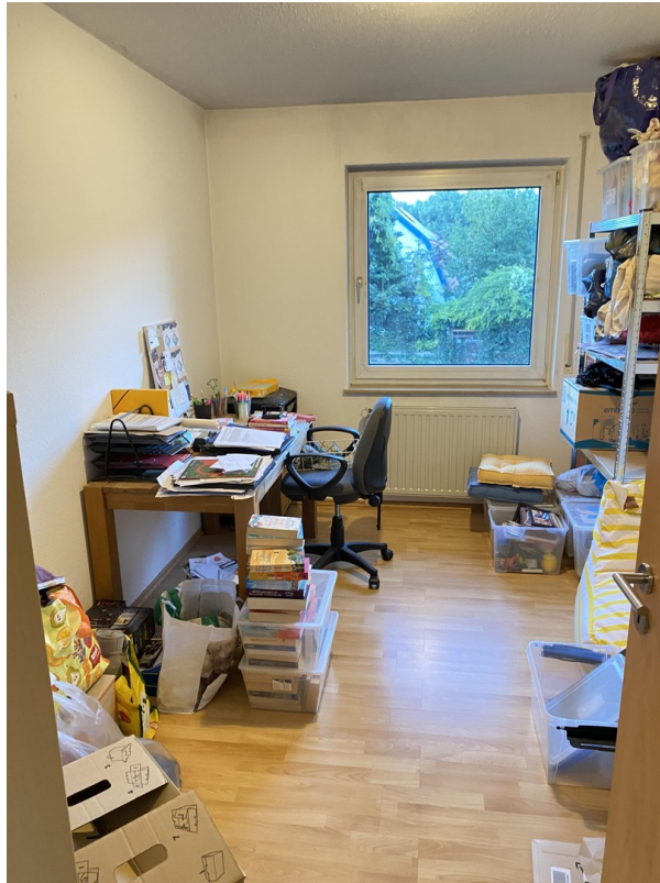
Büro oder Kinderzimmer