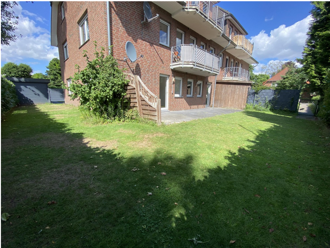
Balkon mit Blick in Garten