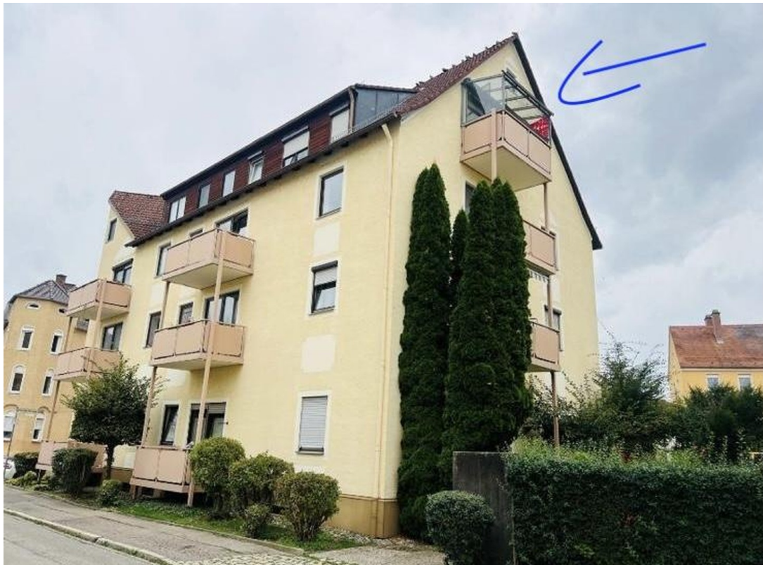
Hausansicht mit Balkon