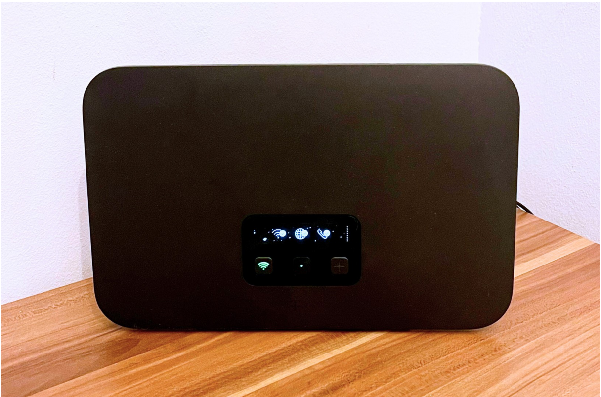
Wifi ist inklusive