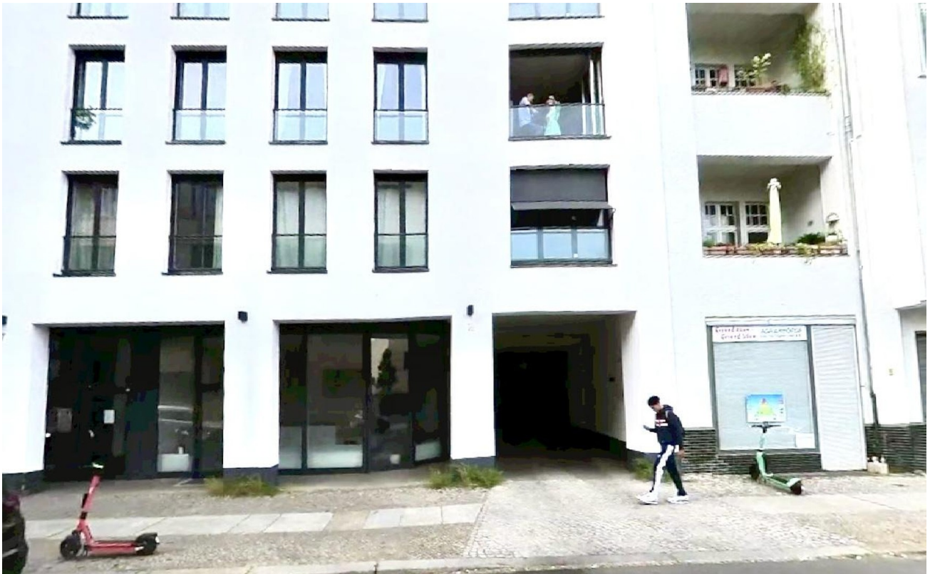
Haus von Straßenseite