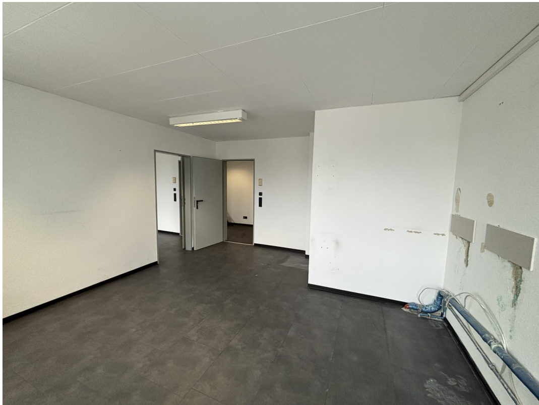
Büro 1 optional Küche