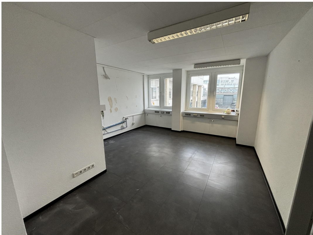
Büro 1 optional Küche