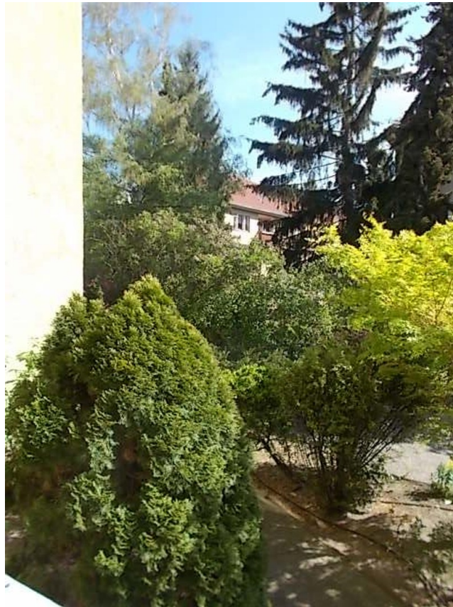
Sommer vor dem Haus