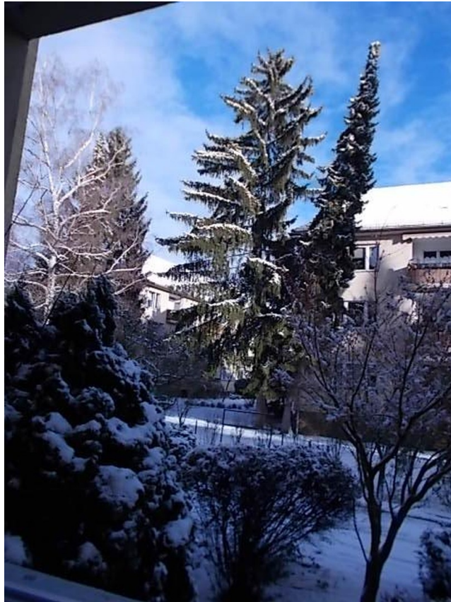
Winter vor dem Haus