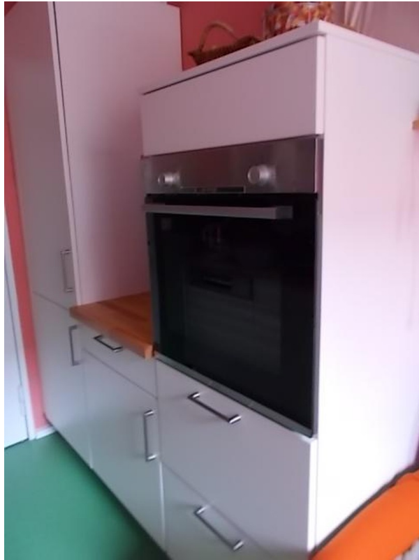
Küche - Markengeräte