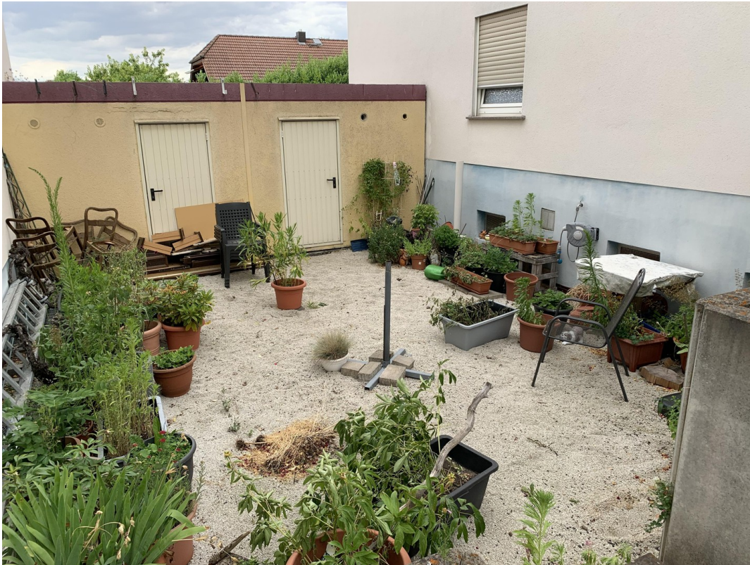
Gartenanteil (Zugang über Gara