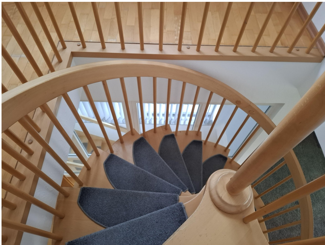
Holzspindeltreppe von oben