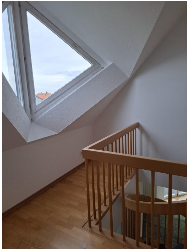
Platz für kl . Schreibtisch