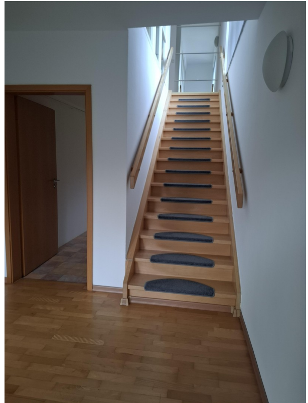
Treppe aus EG