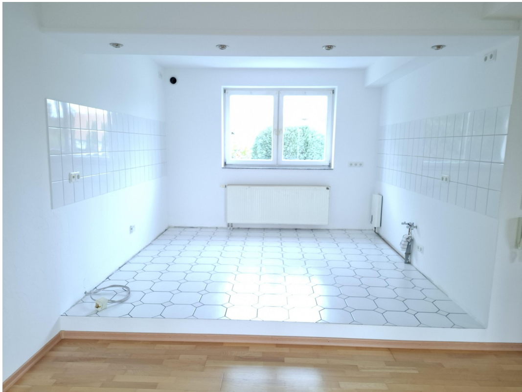
offener Küchenbereich geräumt