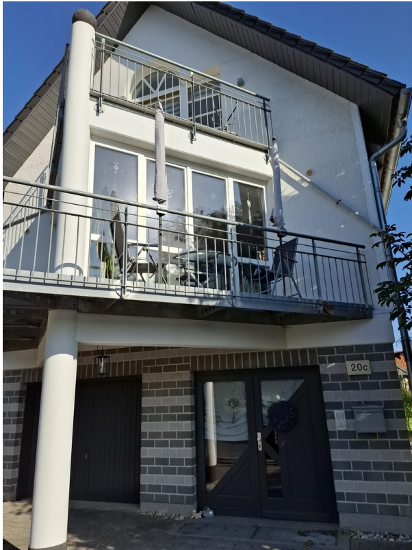
Balkonsteg vor Fensterfront