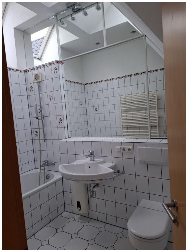
Badezimmer im DG