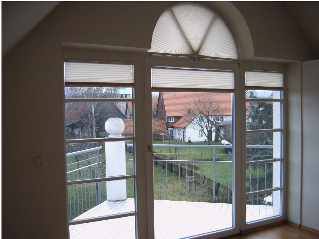
Schlafzimmer mit Dachterasse