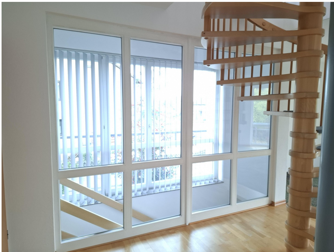
Teppenbereiche mit Fenster