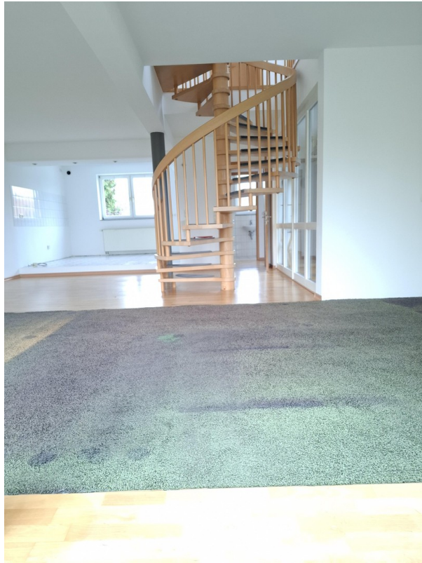
Wohnmittelbereich mit Parkett