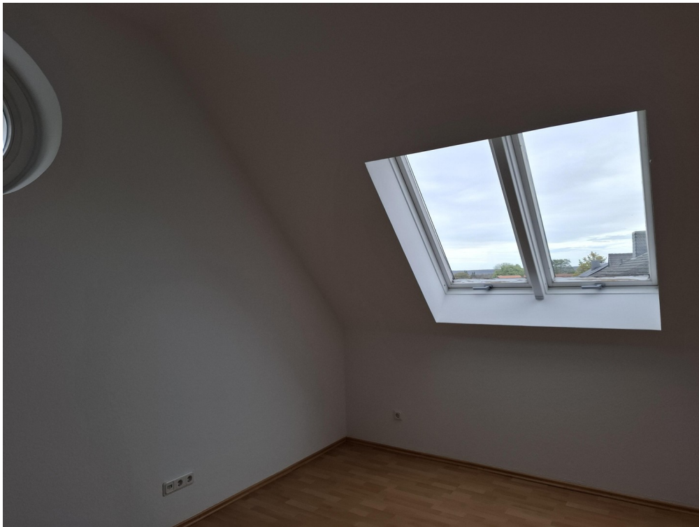
Schlafzimmer mit Dachfenster