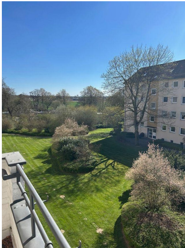
Aussicht vom Balkon