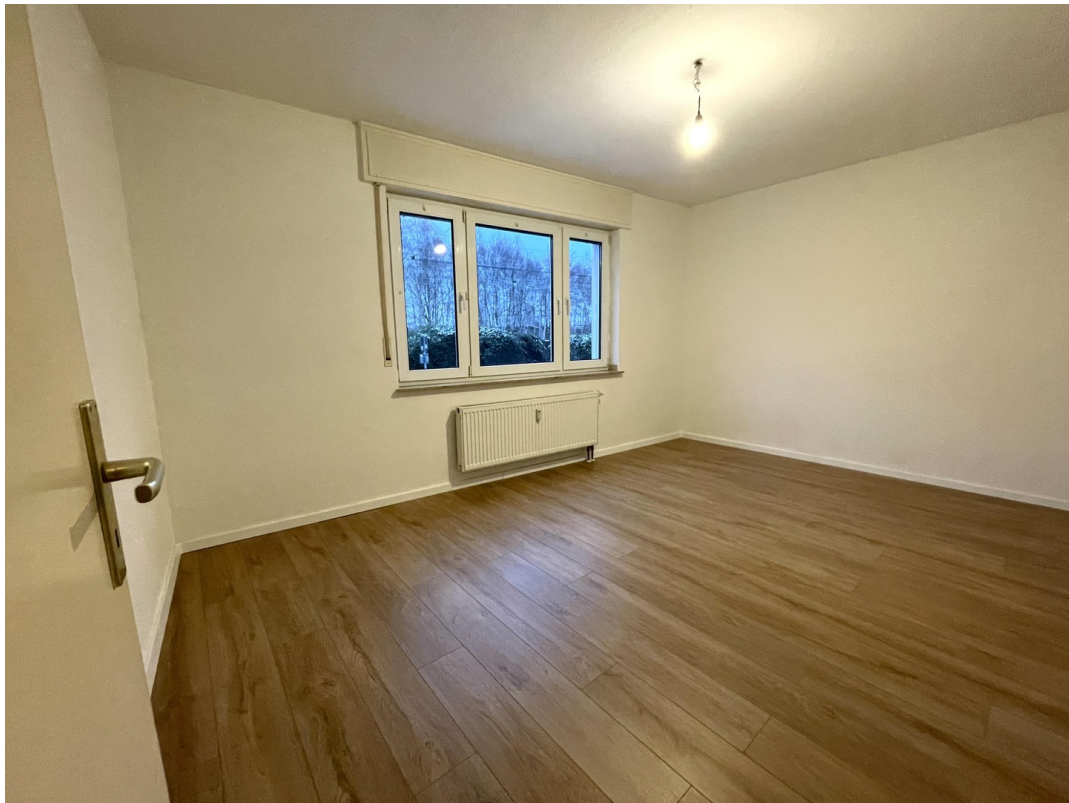
Schlafzimmer Blick zum Fenster