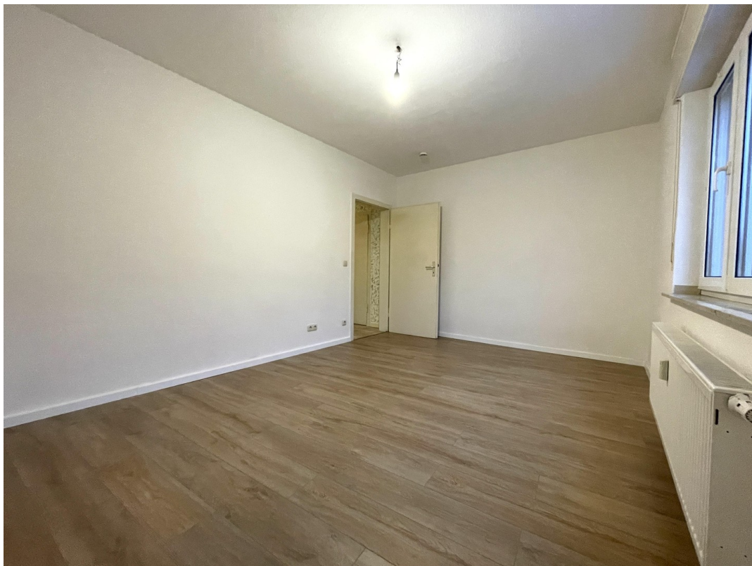
Schlafzimmer Blick zur Tür