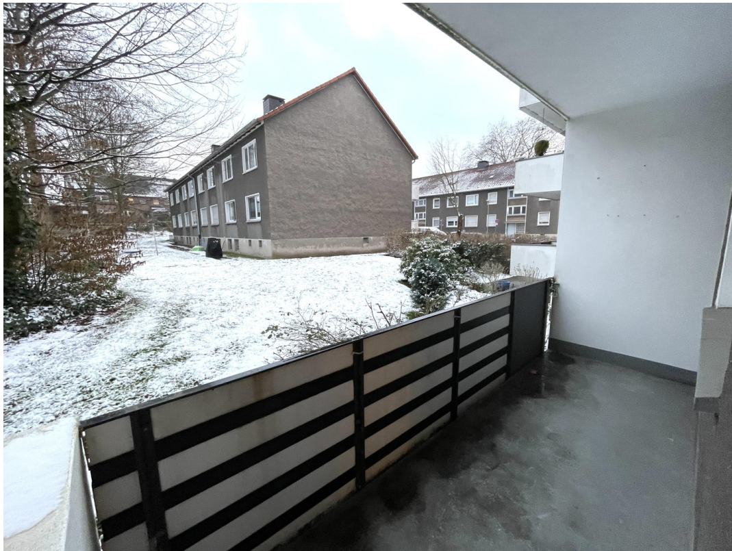
Balkon mit Blick ins Grüne