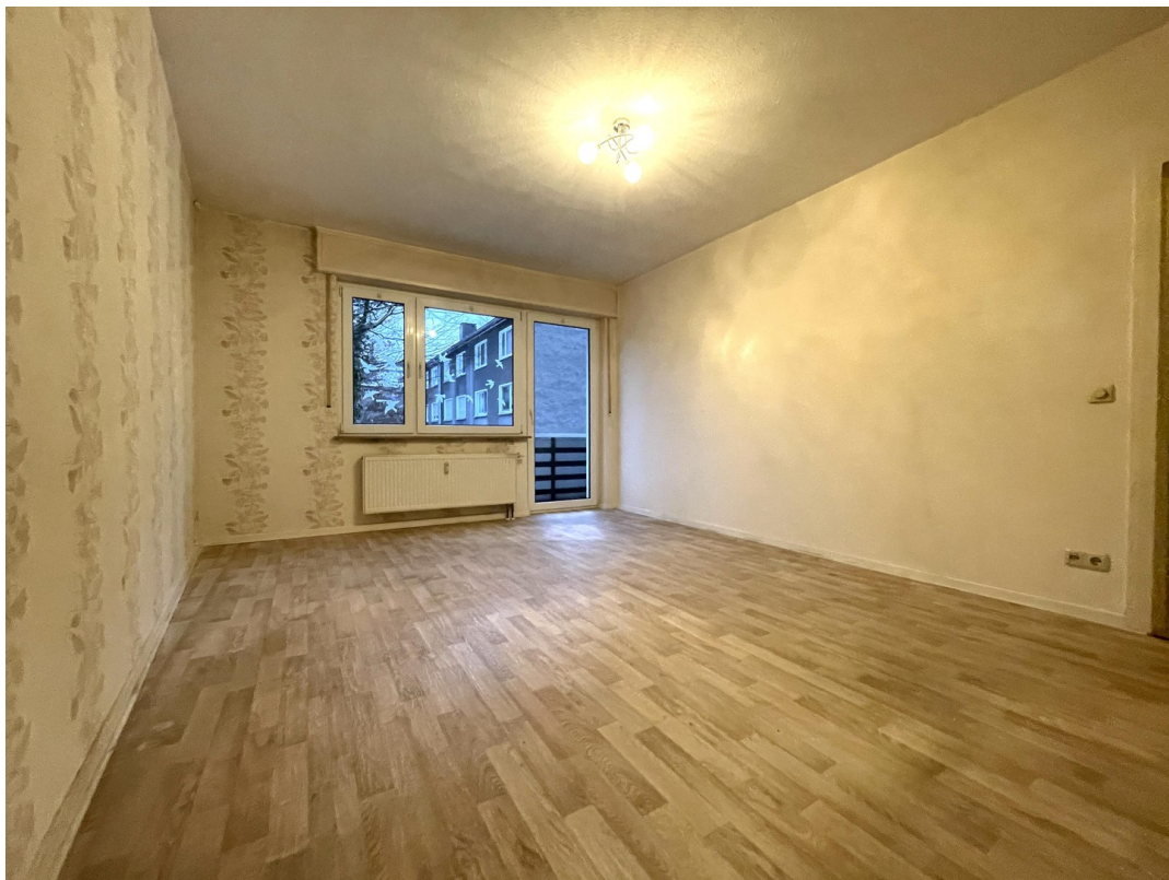
Wohnzimmer mit Balkon