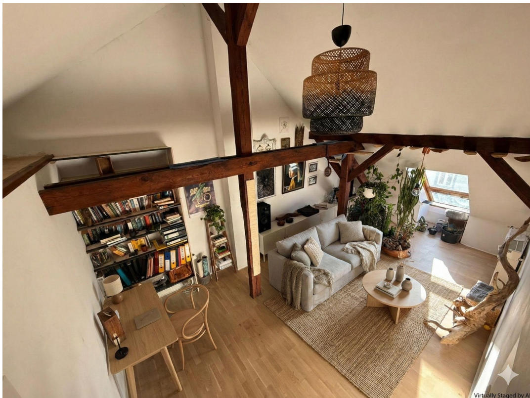
Wohnzimmer andere Möbel