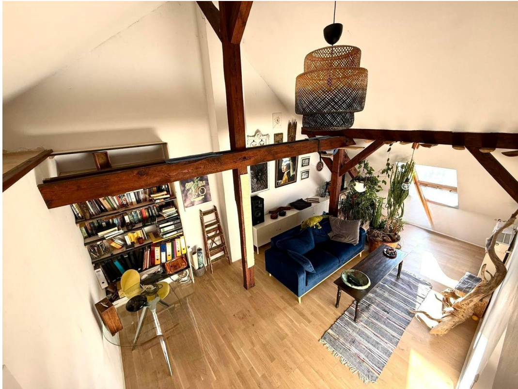
Wohnzimmer von oben