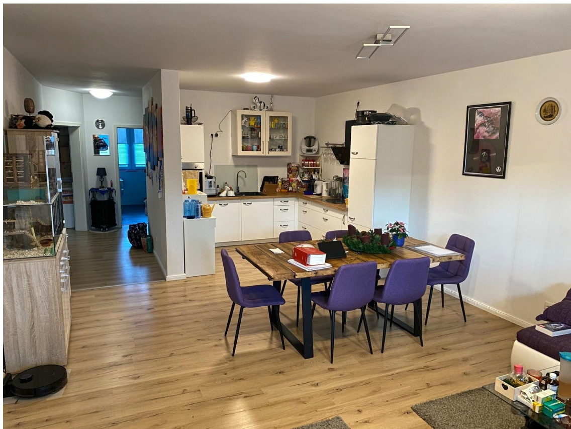
Küche u Wohnbereich