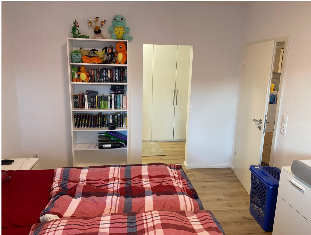
Schlafzimmer mit Ankleide