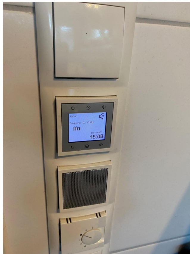
Bad Radio in Schalterleiste