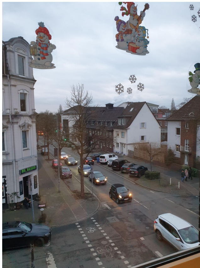
Blick auf die Straße