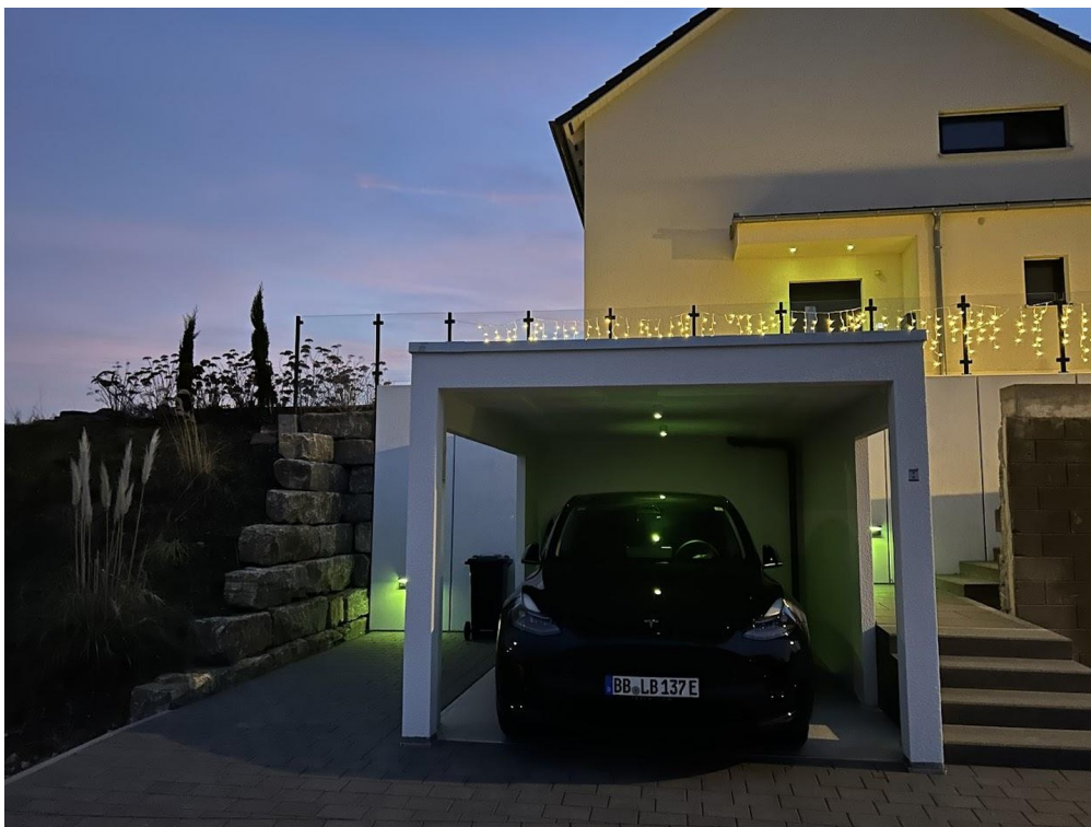
Carport inkl. Wallbox