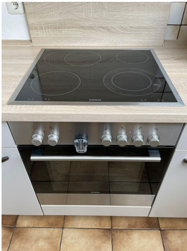
Küche zur Übernahme