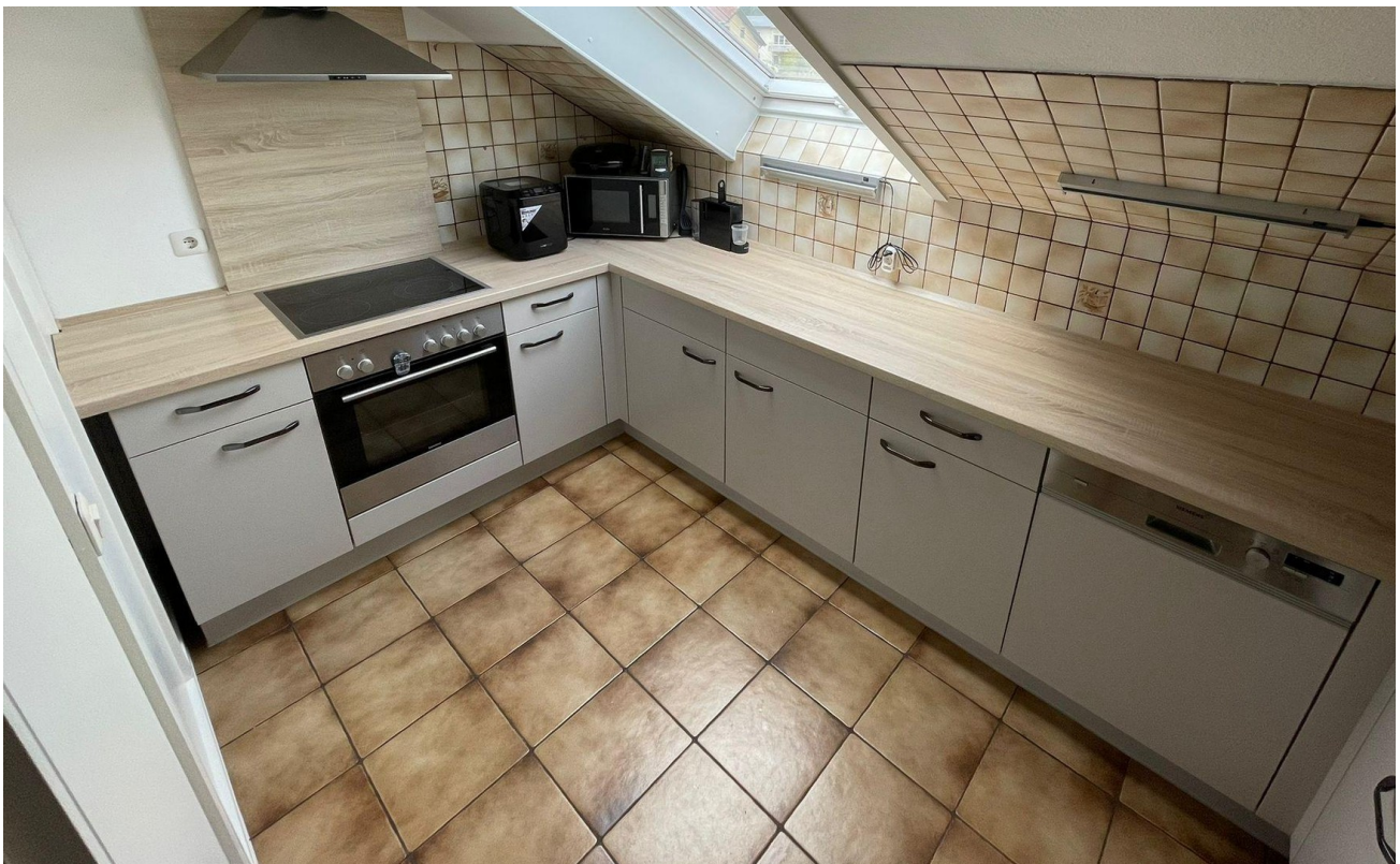
Küche zur Übernahme