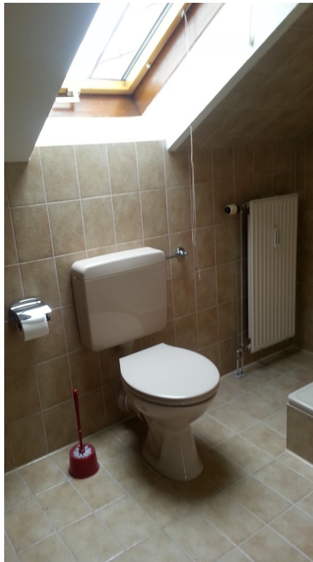
Bad mit Duschkabine