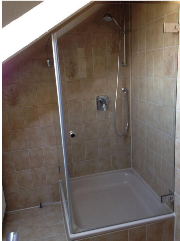
Bad mit Duschkabine