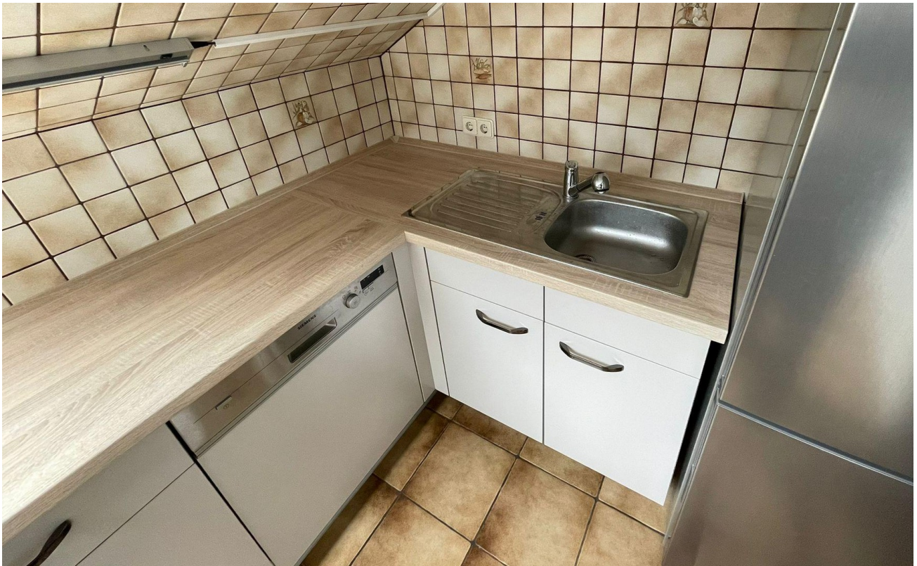
Küche zur Übernahme