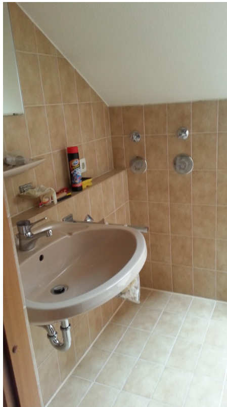
Bad mit Duschkabine