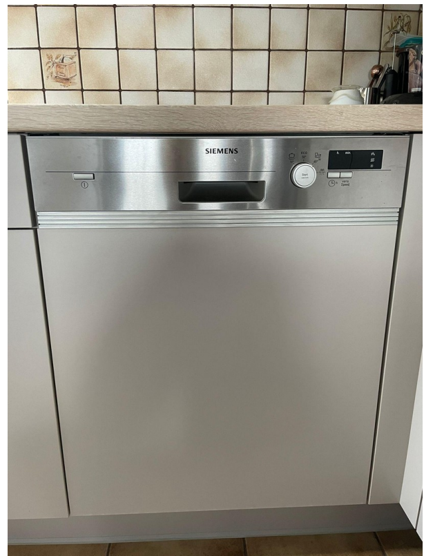
Küche zur Übernahme