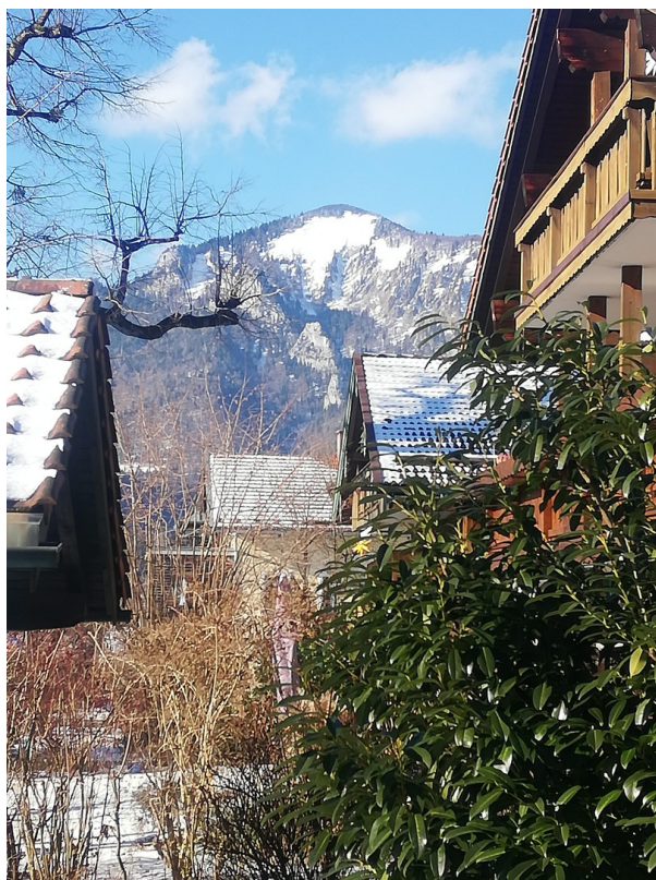
Ausblick auf die Hochplatte