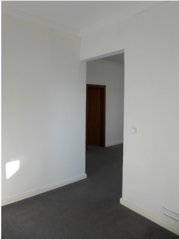
Blick in d. Flur+Abstellkammer