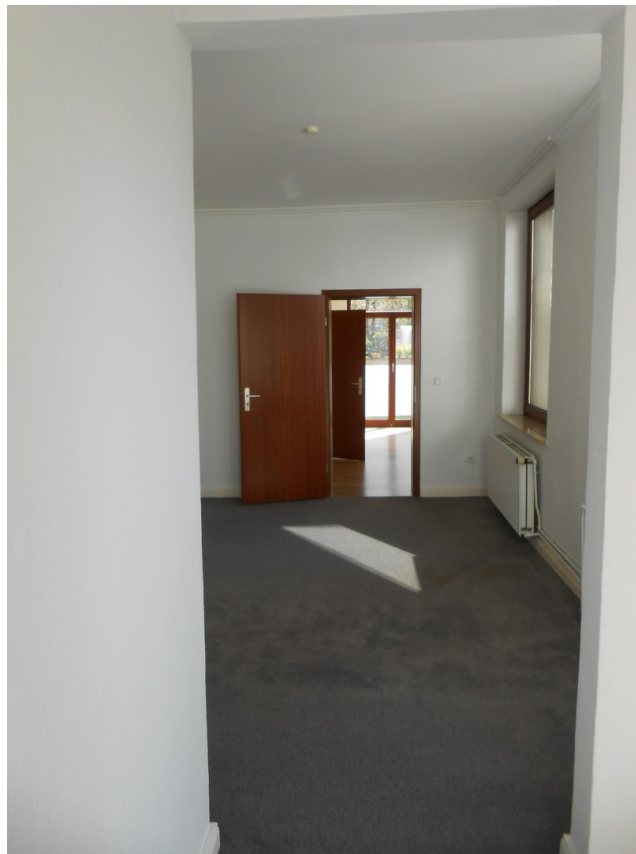
Schlafzimmer Blick ins Wohnzi.