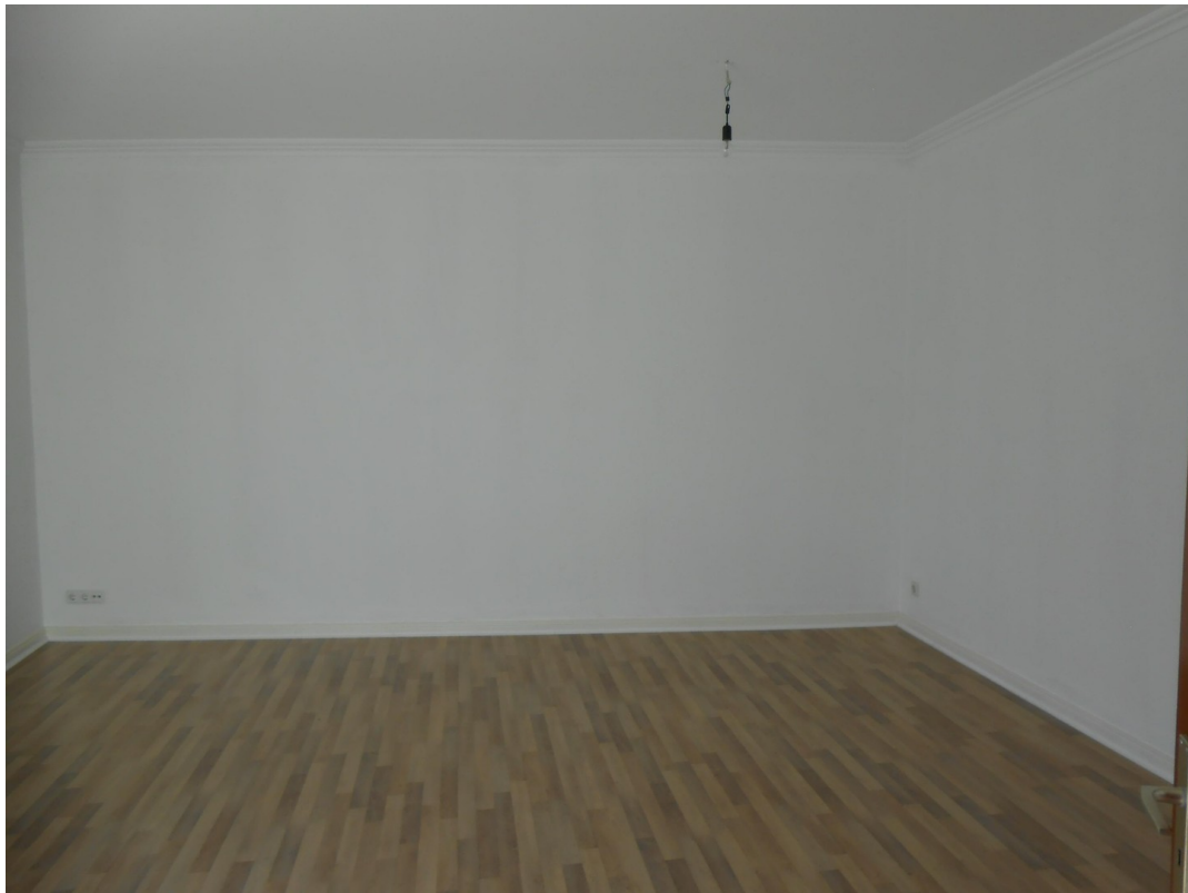
Wohnzimmer Austritt Terrasse