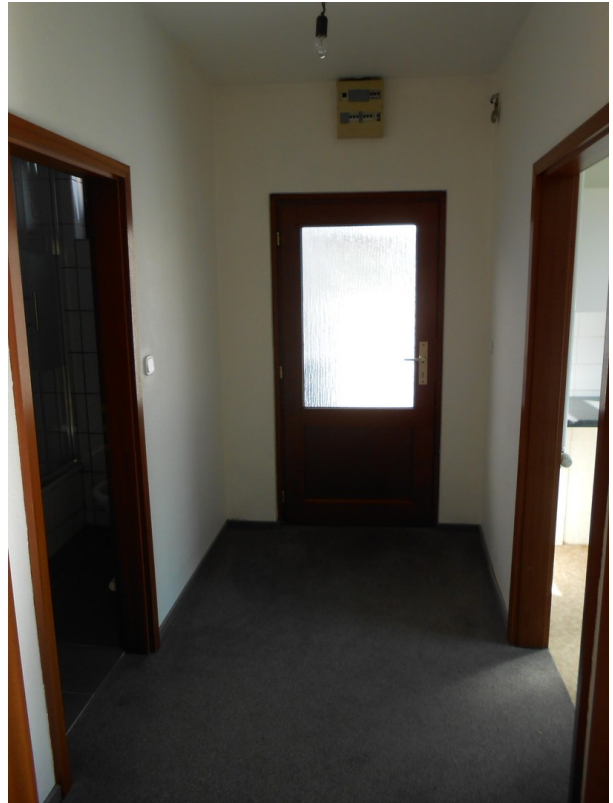
Flur / Eingang