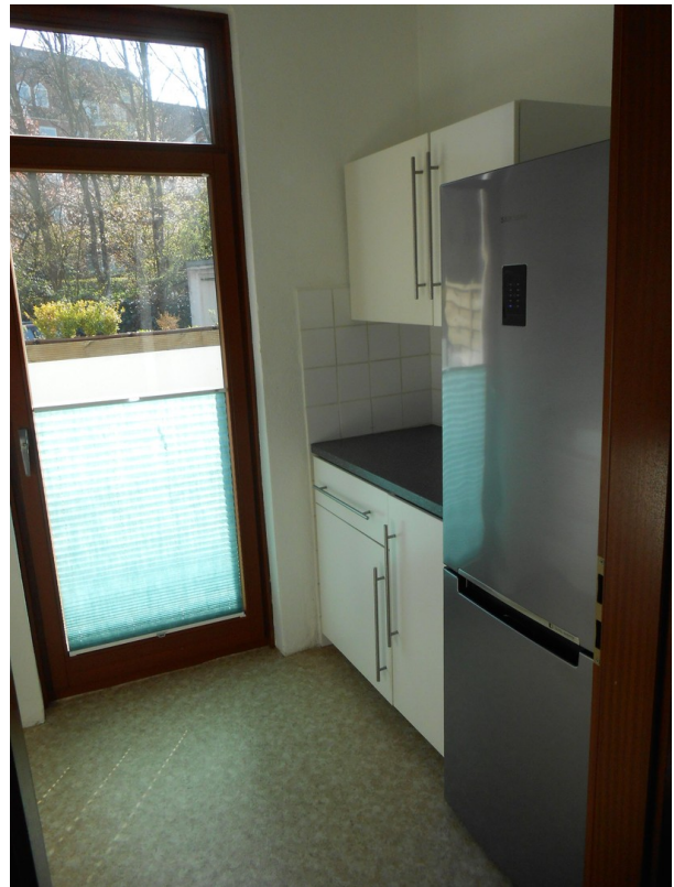
Einbauküche Austritt Terrasse