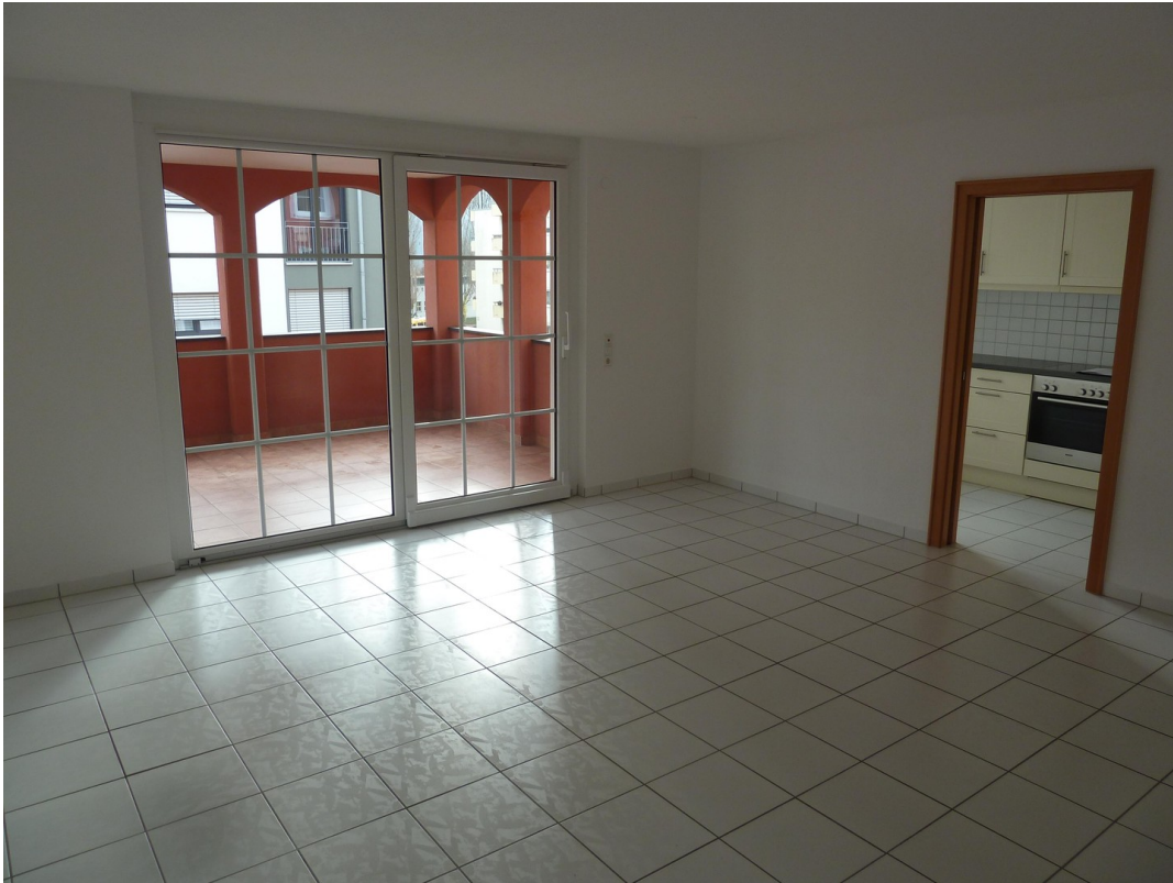
Wohn- & Esszimmer