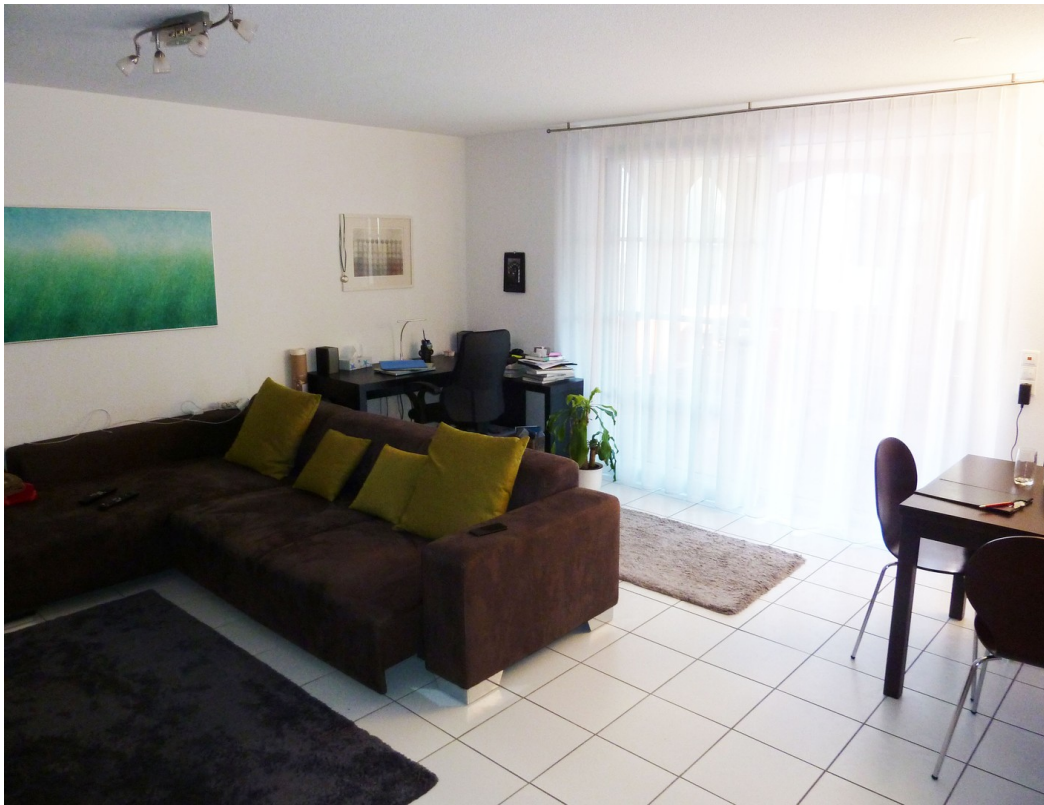
Wohn- & Esszimmer