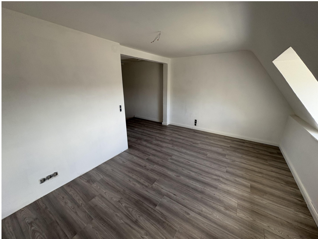
Großes Zimmer im DG