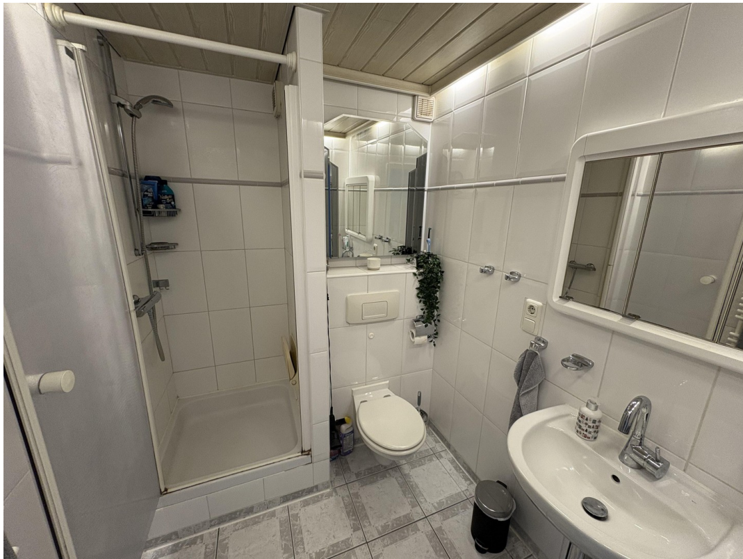
Bad im 1.OG