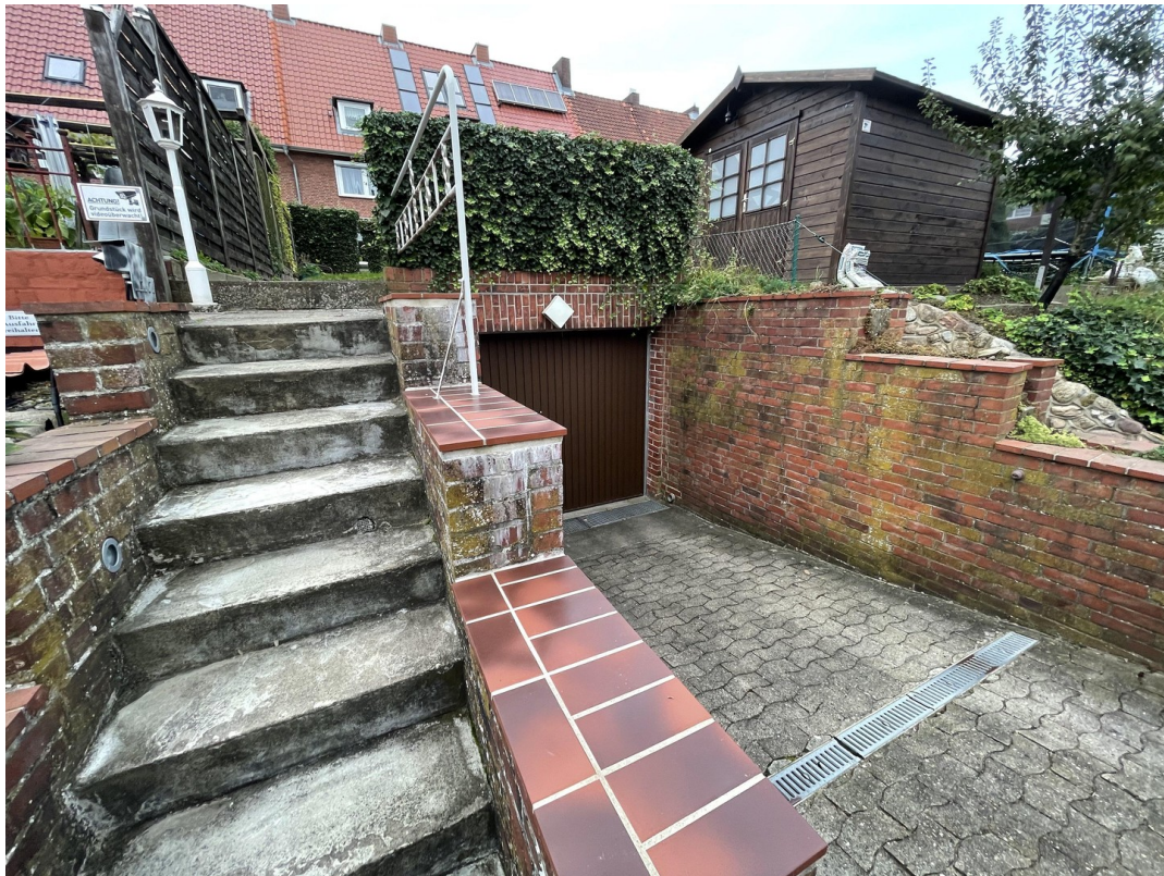
Garage mit Zugang zum Garten