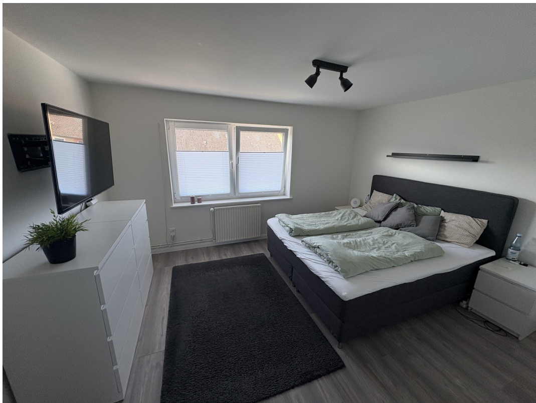
Schlafzimmer im 1.OG