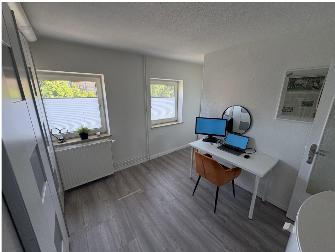
Ankleide im 1.OG mit Treppe