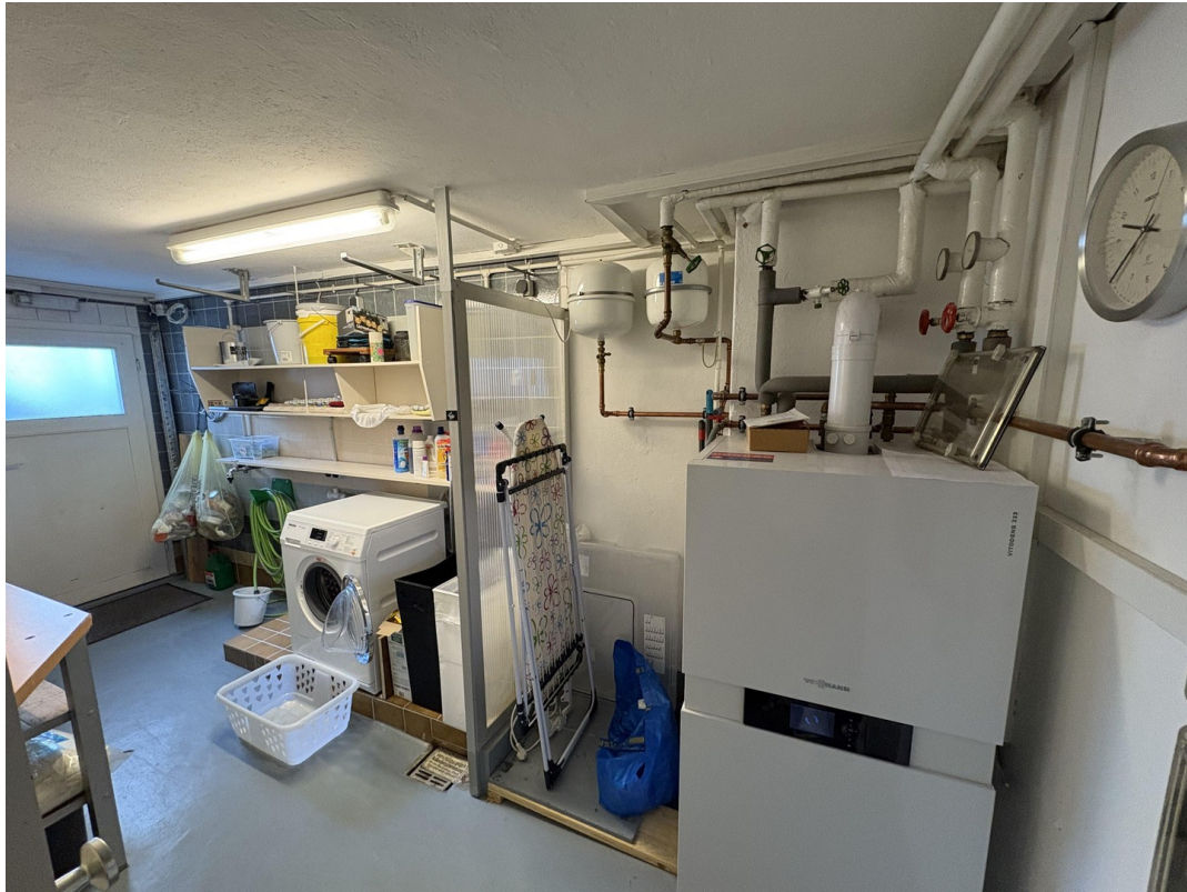
Waschküche im Keller