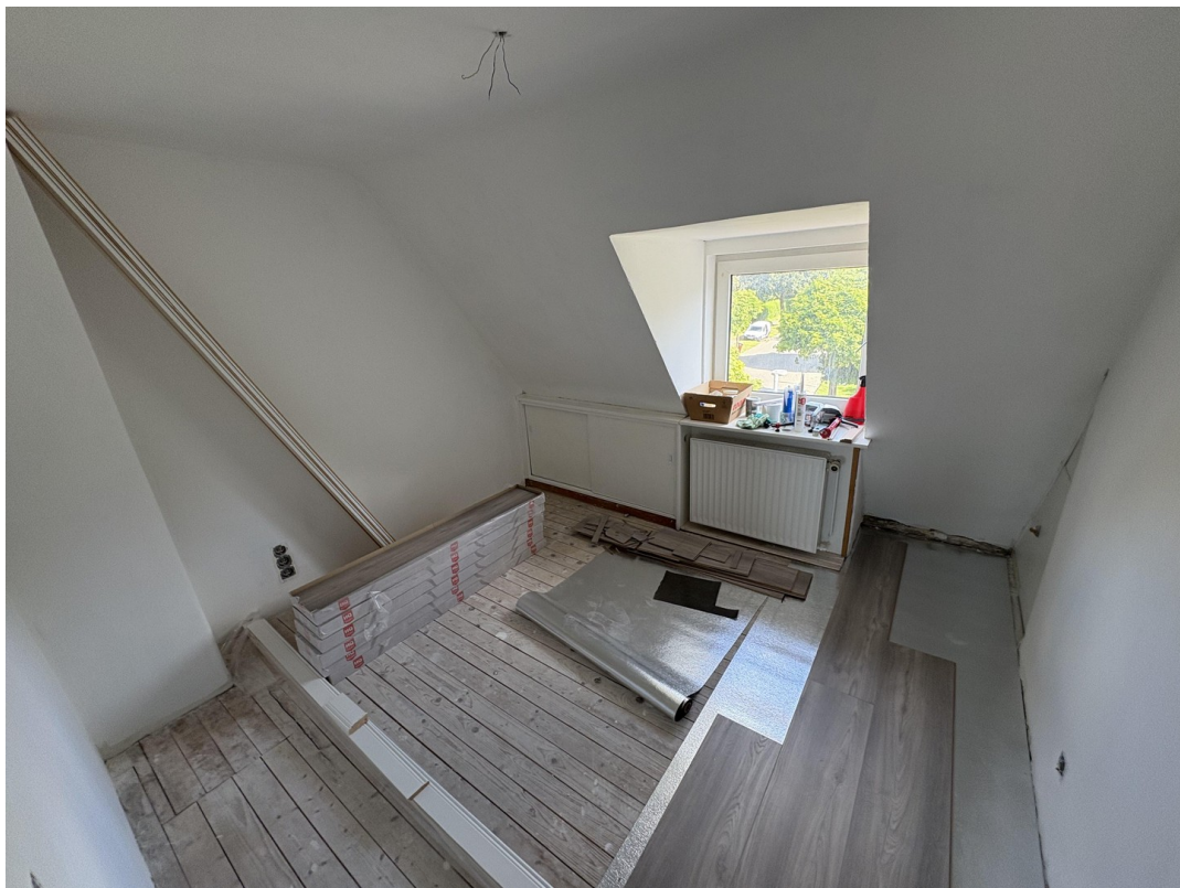
Kleines Zimmer im DG