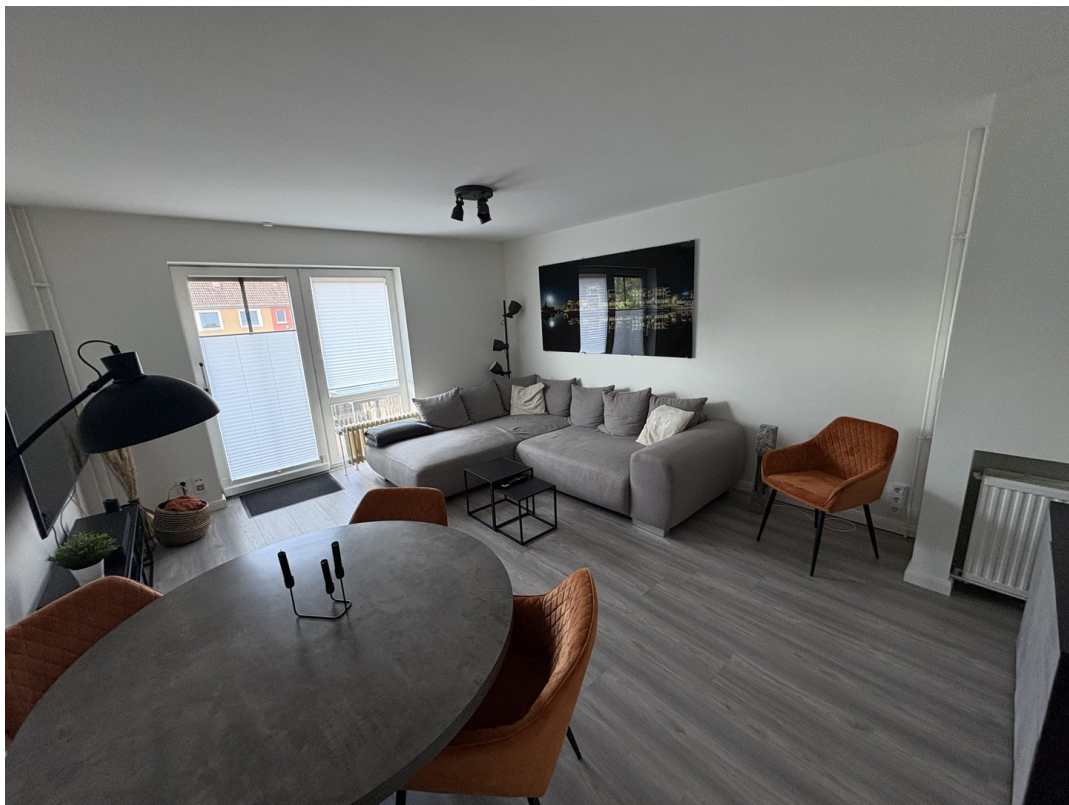
Wohnzimmer im EG