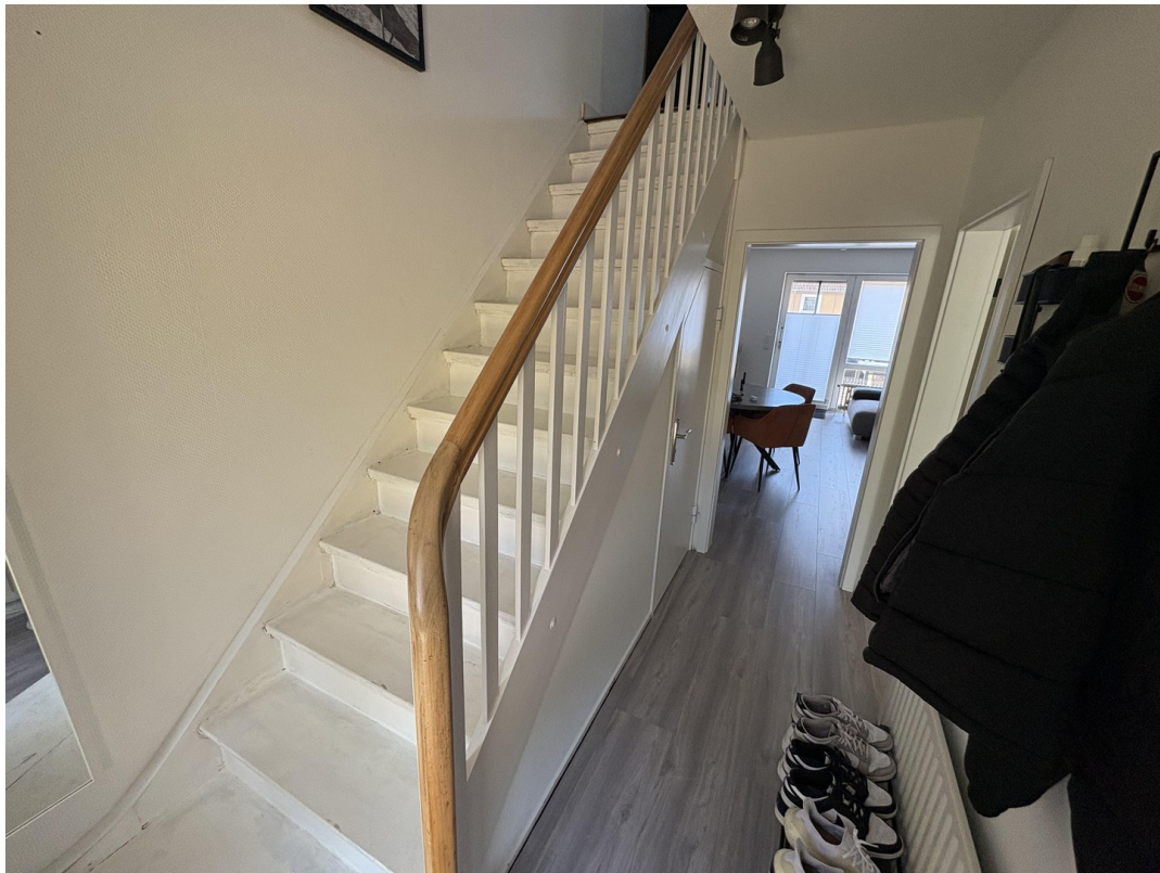
Flur im EG