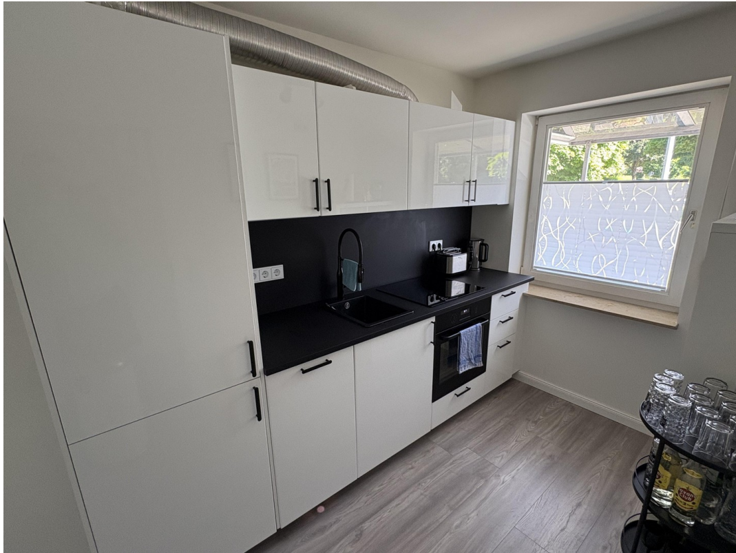
Moderne Einbauküche im EG