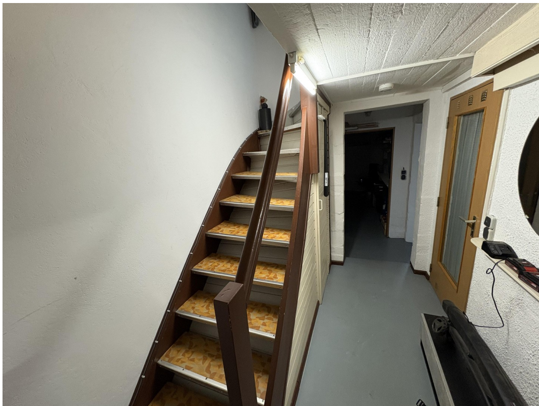
Flur im Keller