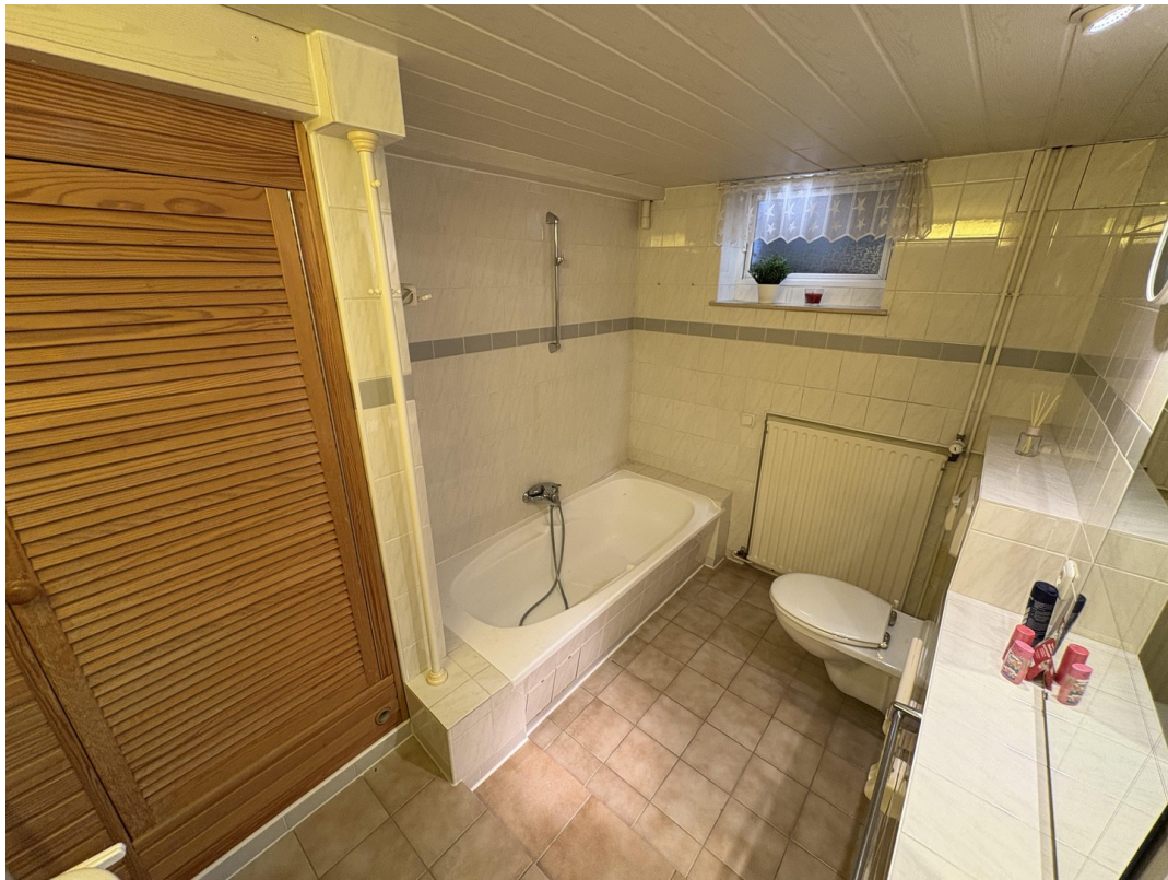
Wannenbad im Keller