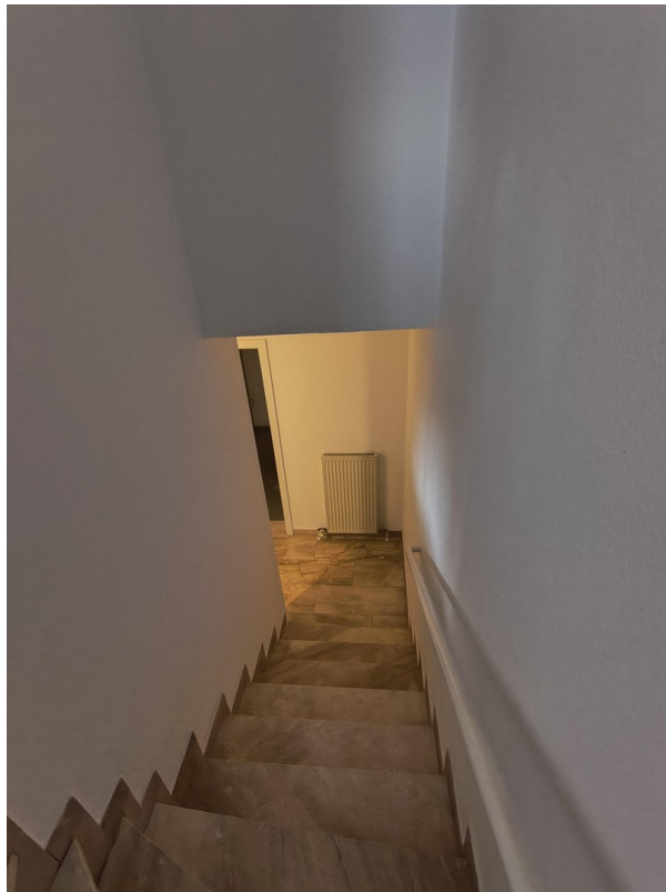
Treppe ins Souterrain