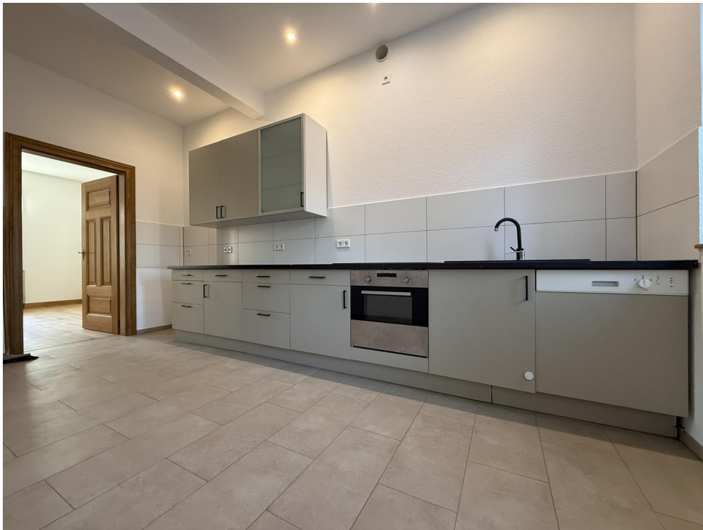
Küche Ansicht 2