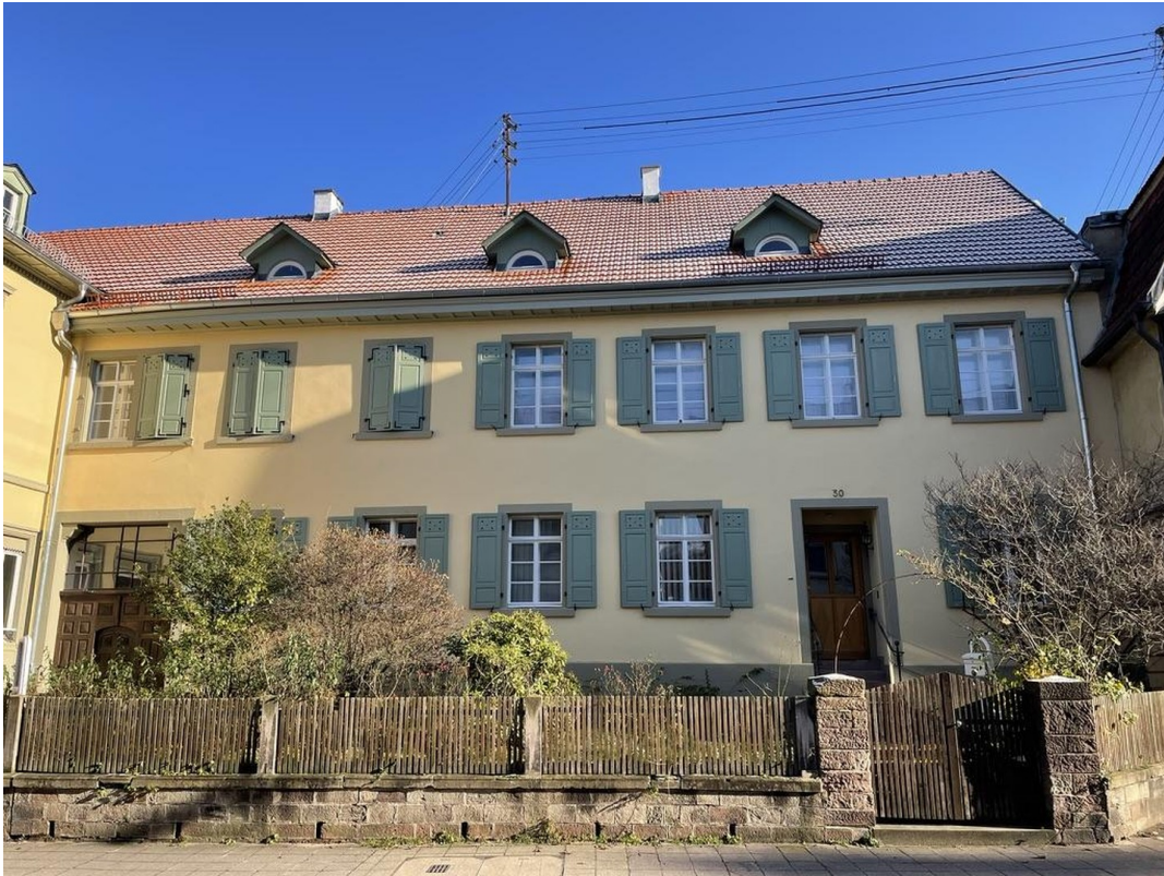
Ansicht Eingang mit Vorgarten