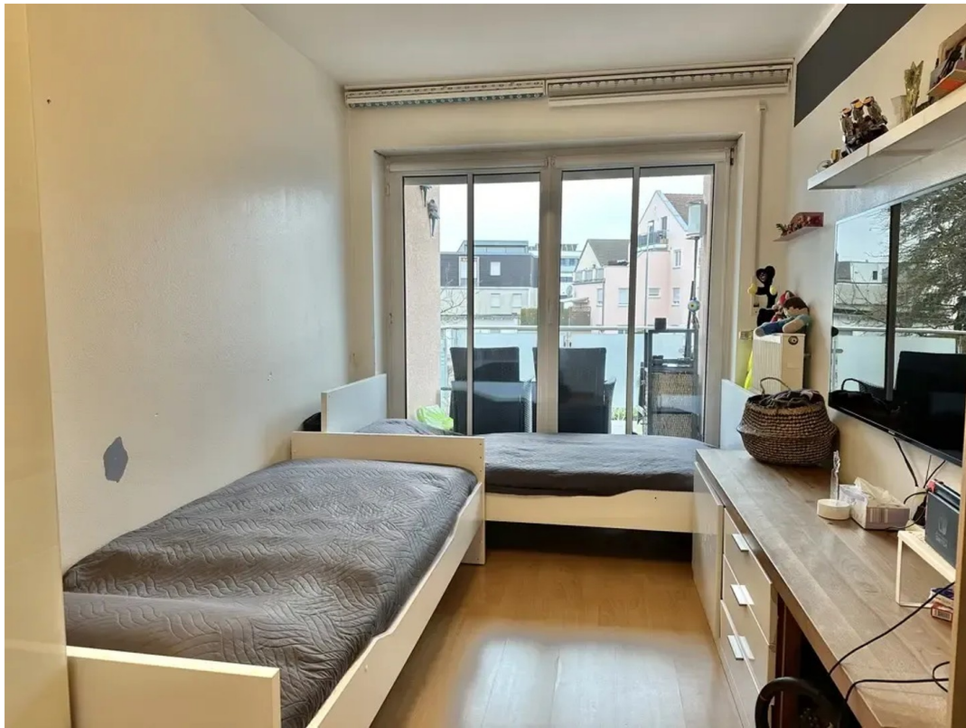
Kinderzimmer / HomeOffice