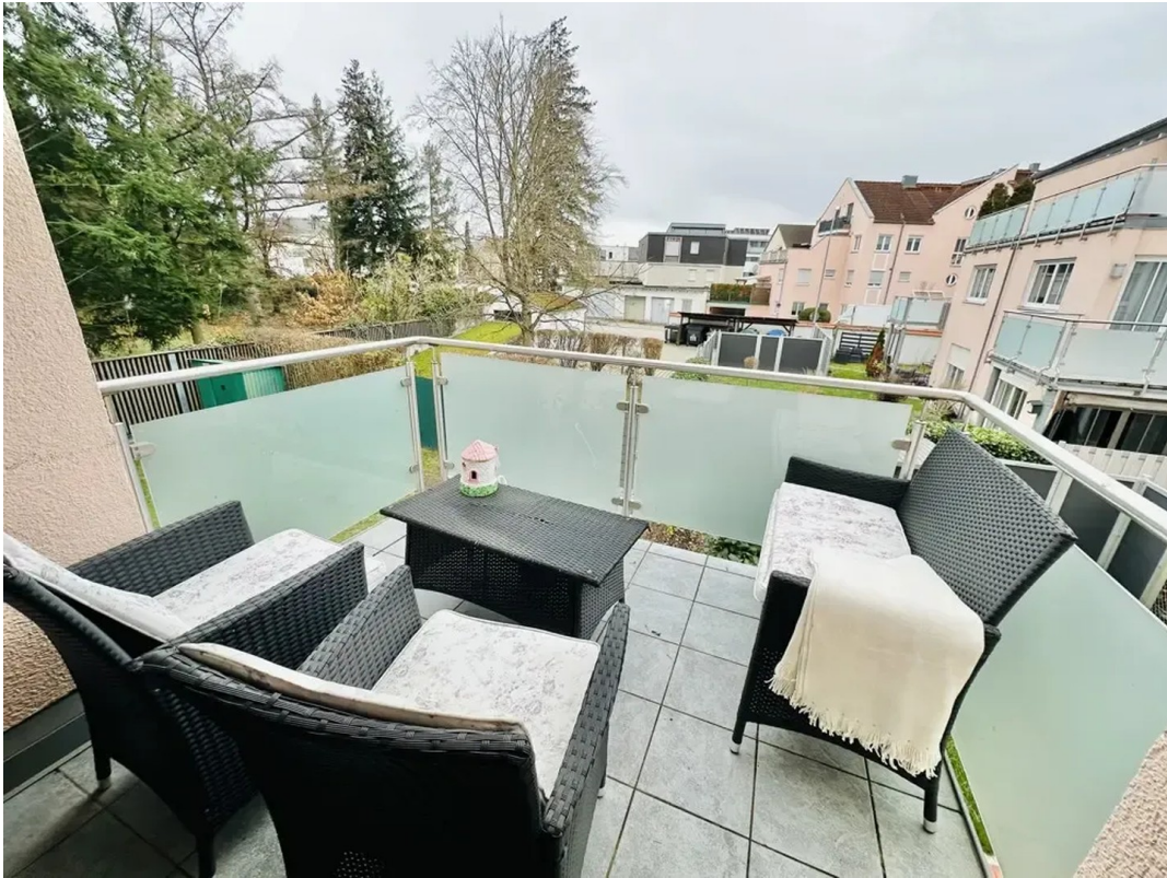
Balkon mit Südausrichtung