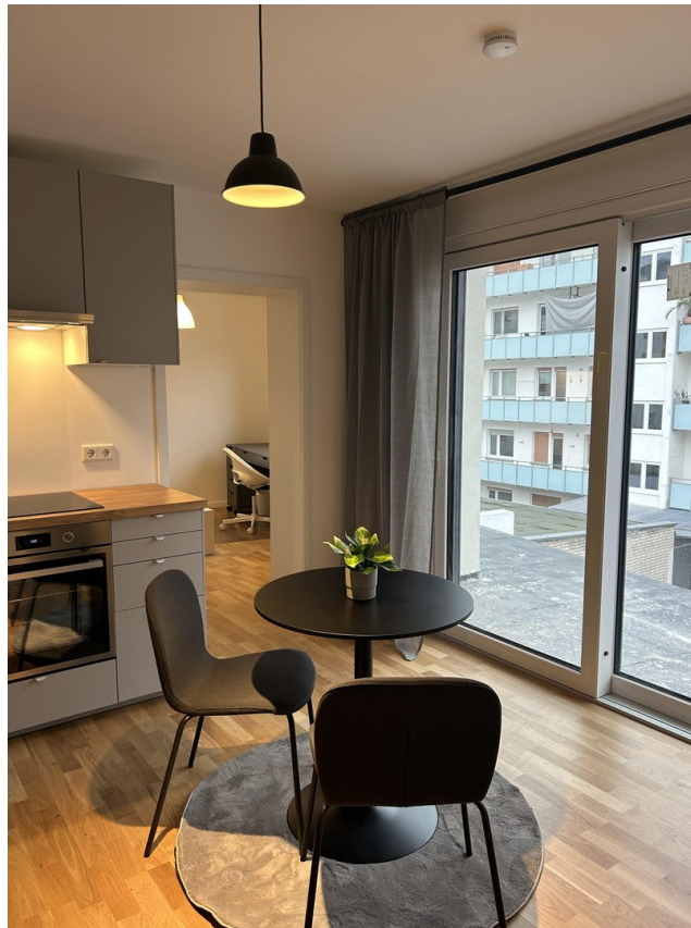
Küche mit Balkon