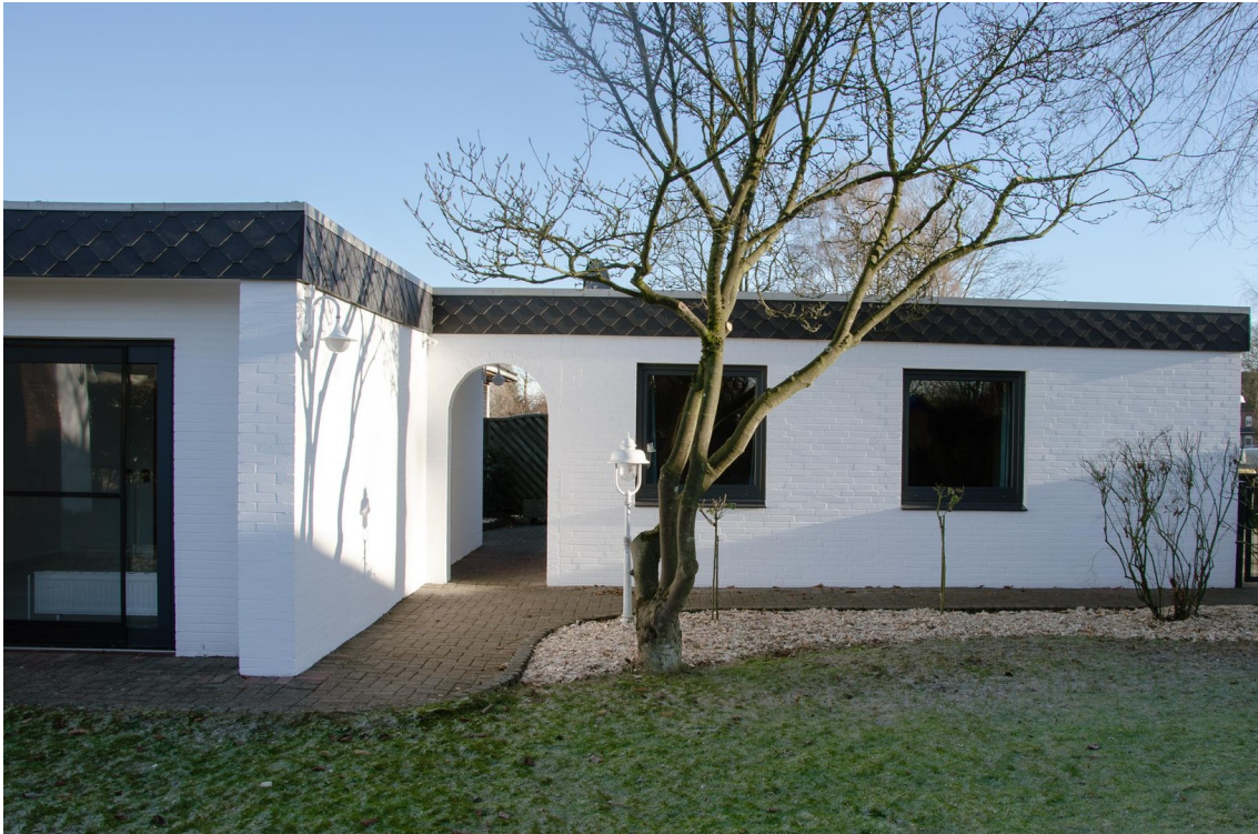
Garage und Zuwegung