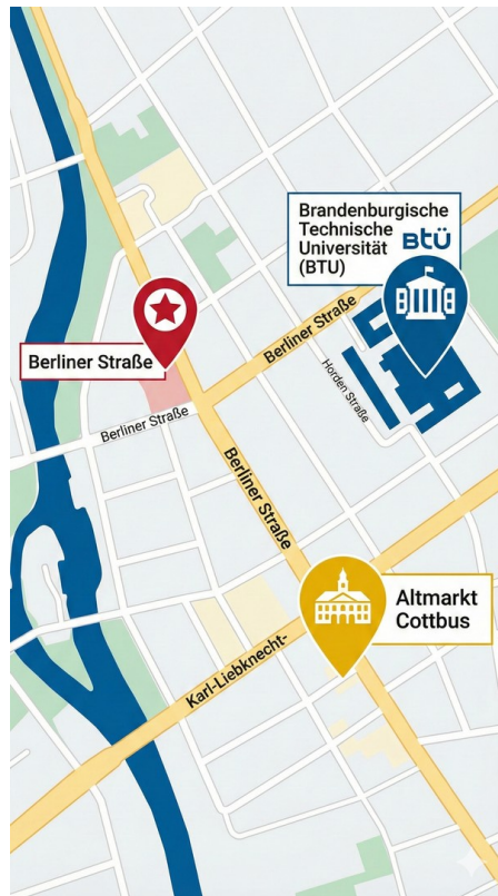
Schematische Darstellung Lage