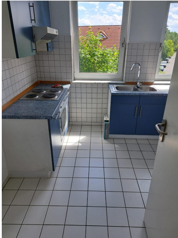
Blick vom Flur in die Küche