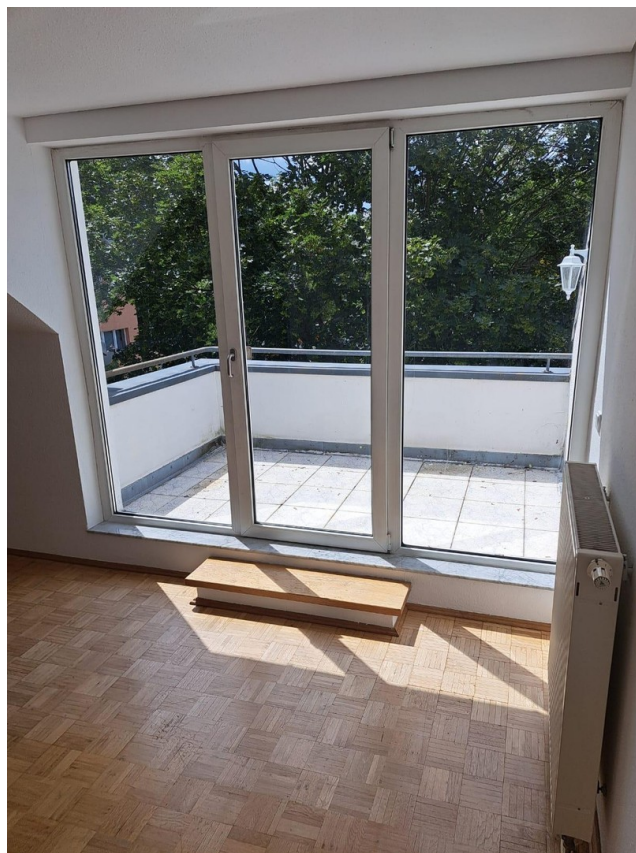
Blick auf die Terrasse