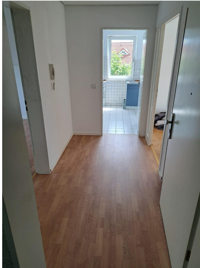
Blick in den Flur