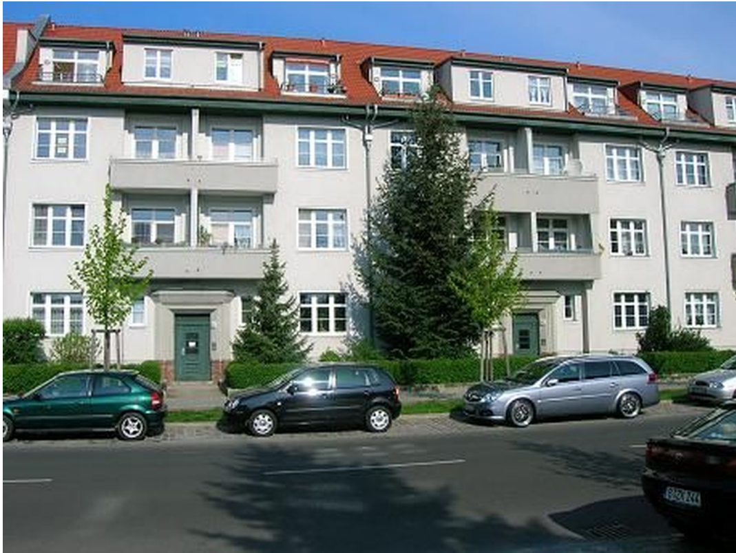
Blick v. d. Straße a. d. Haus