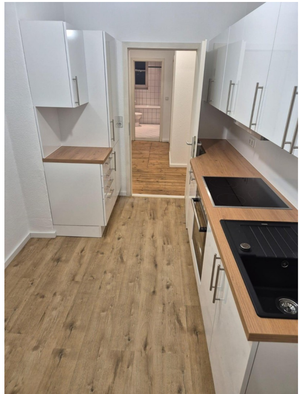
Küche (Blick Richtung Flur)