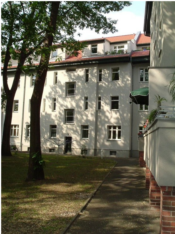
Blick a. d. Haus v. Garten aus