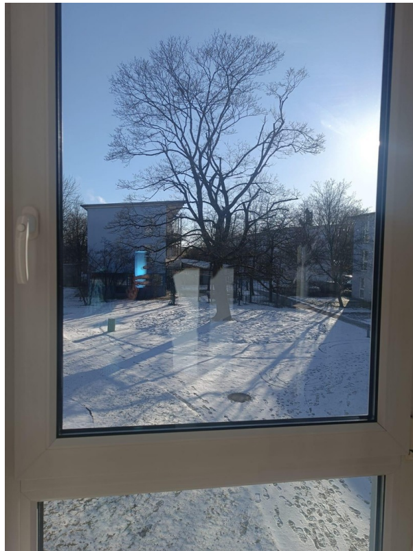
Kastanienbaum im Winter