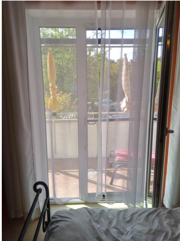
Schlafzimmer zum Balkon