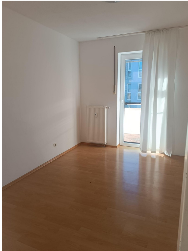
Kinderzimmer o. Büro