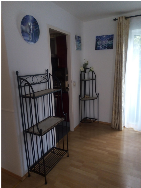
zur Küche hin