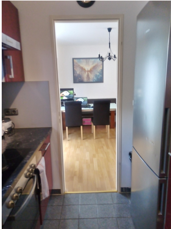
Blick von Küche zum Essbereich