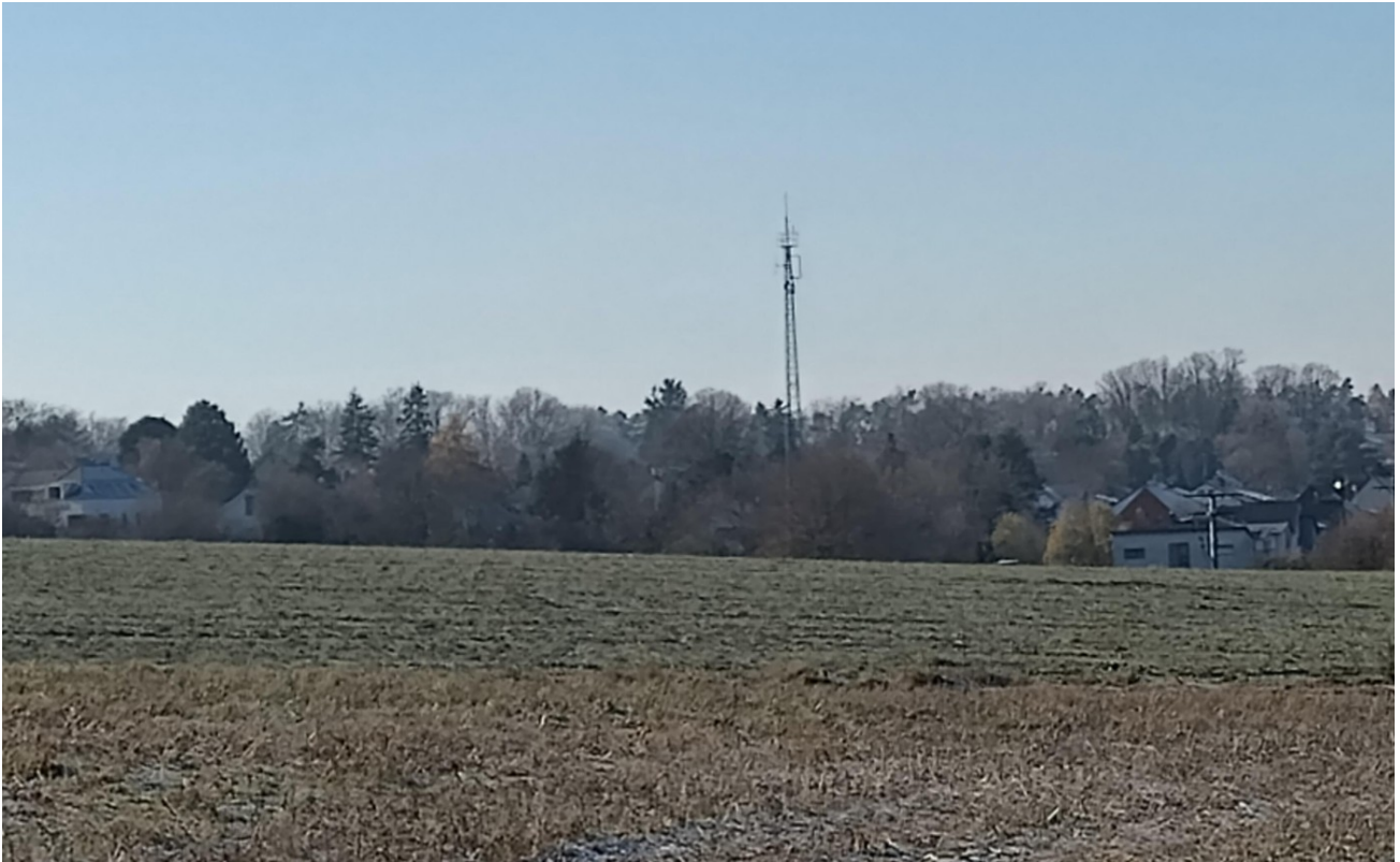
Blick auf Rathsburg