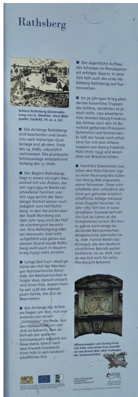
Info Tafel zu Rathsburg