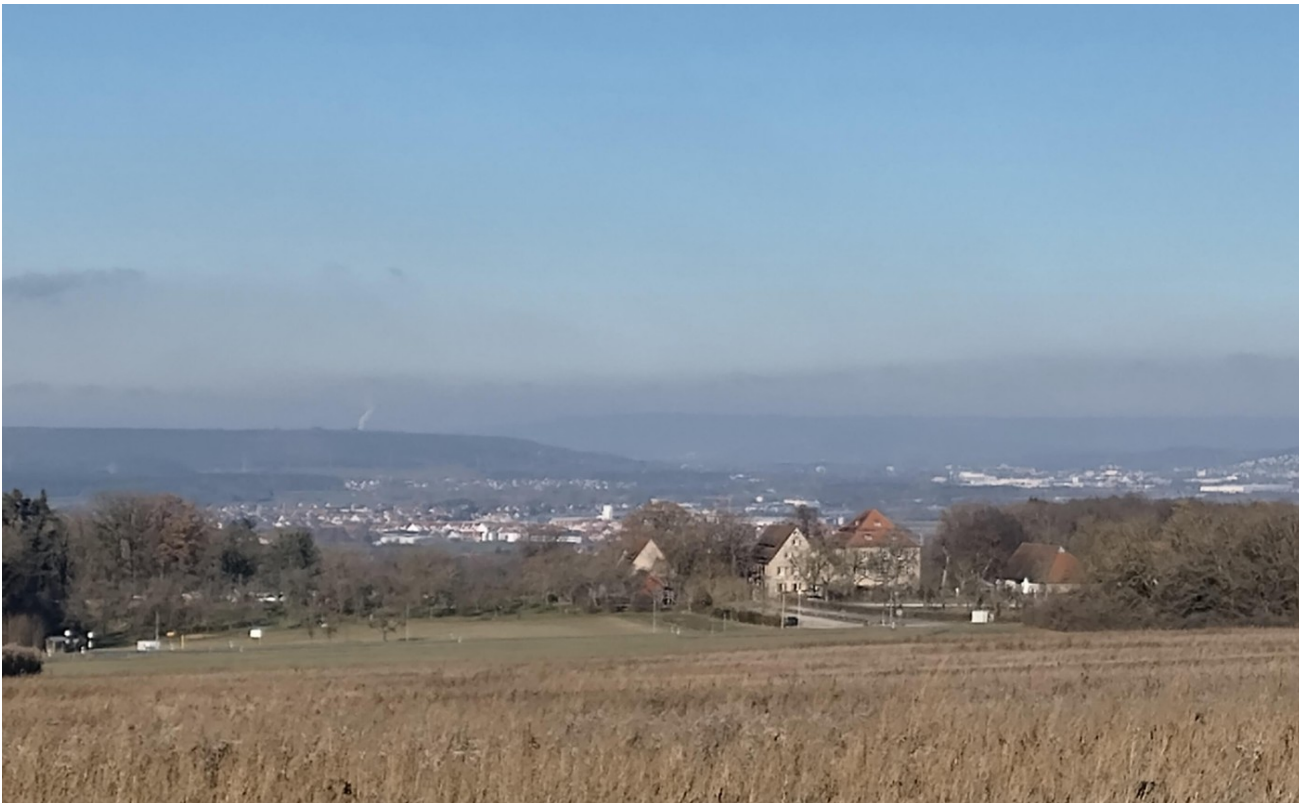
Blick ins Regnitztal