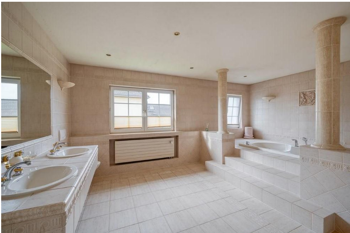
Bad mit Badewanne