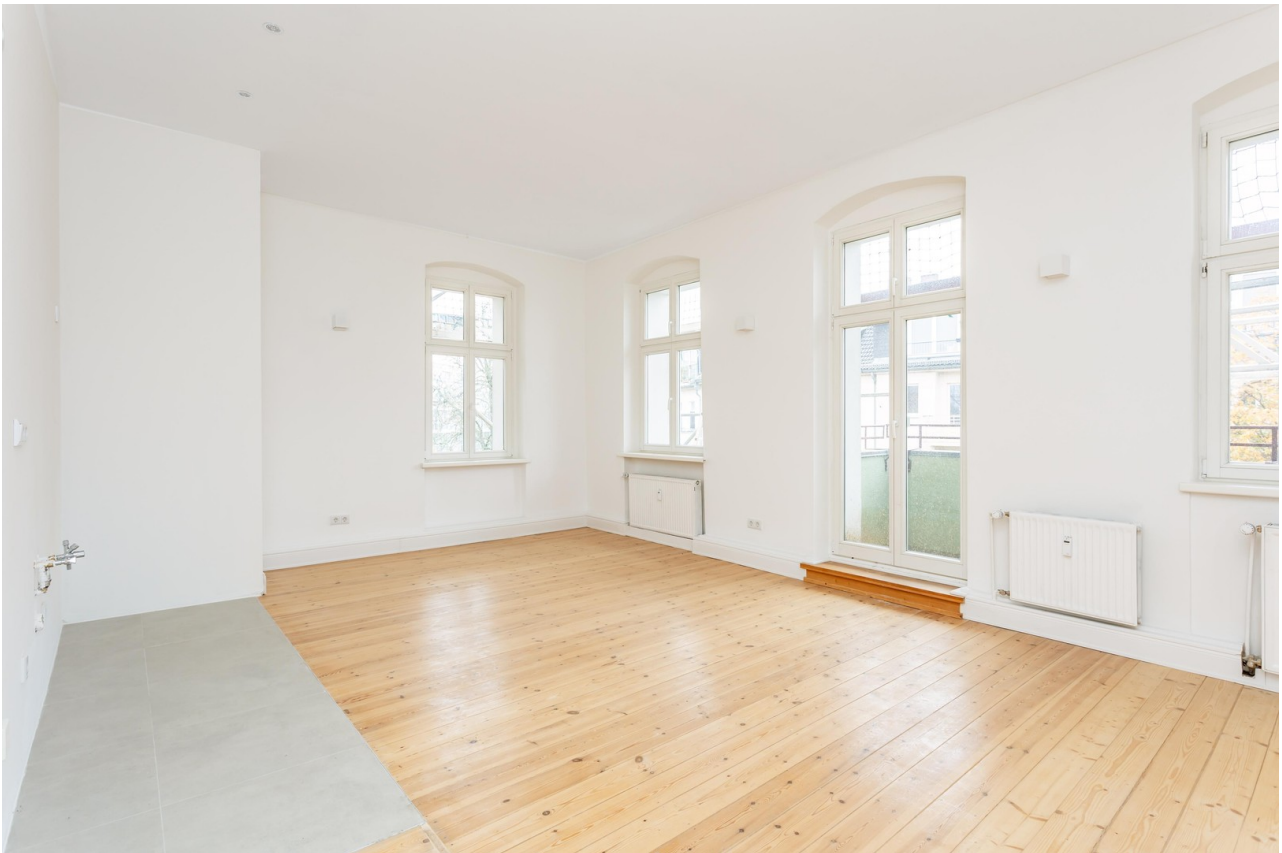
Wohnzimmer mit offener Küche