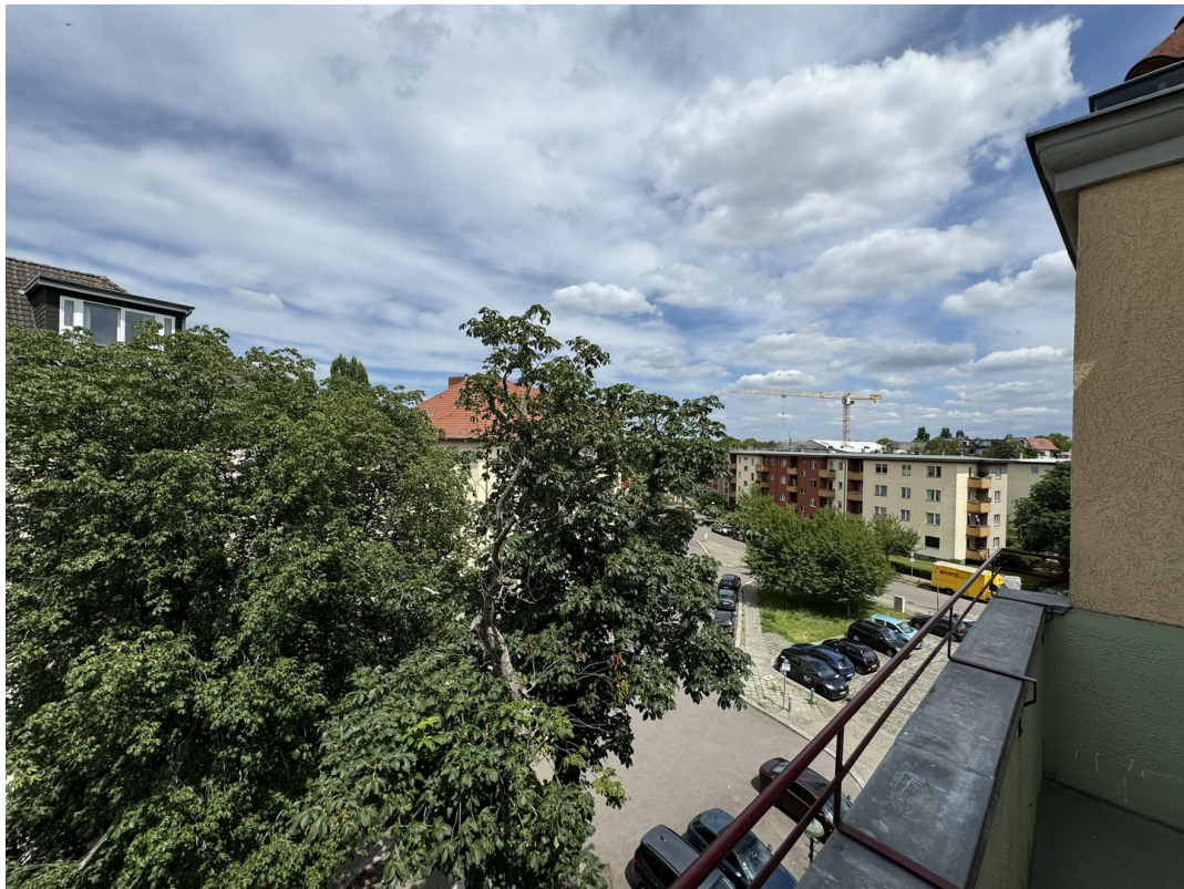
Blick ins Grüne