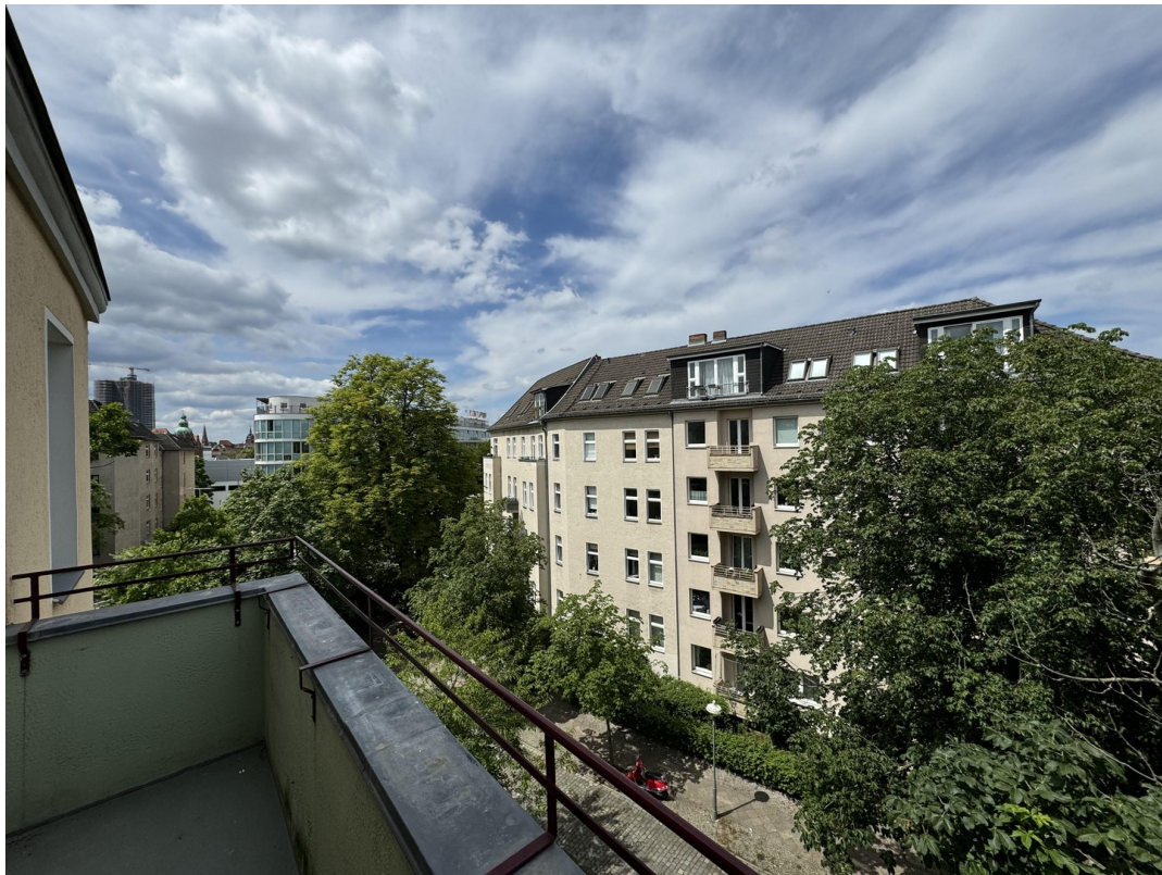
Blick ins Grüne