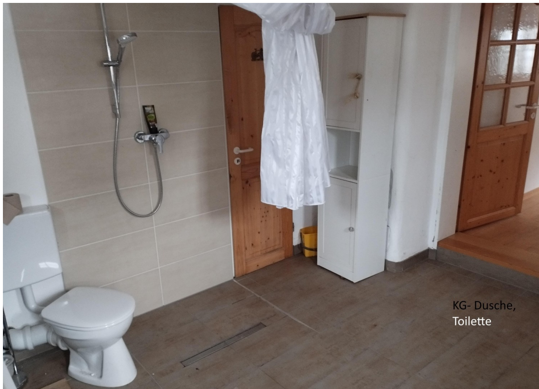
KG- Dusche, Toilette