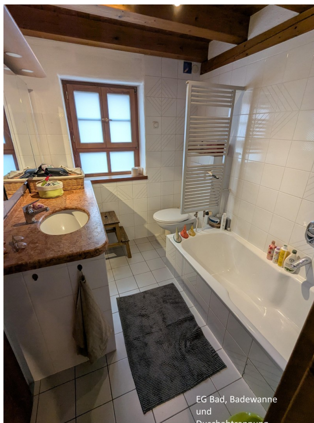
EG Bad, Badewanne und Duschabtrennung