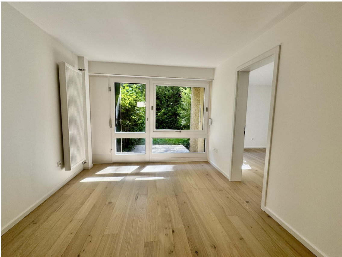
Wohnbereich mit Terrasse