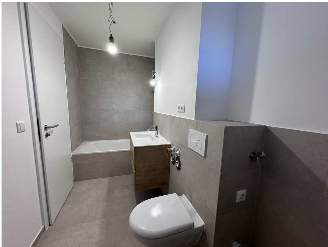
Badewanne und WM-Anschluss