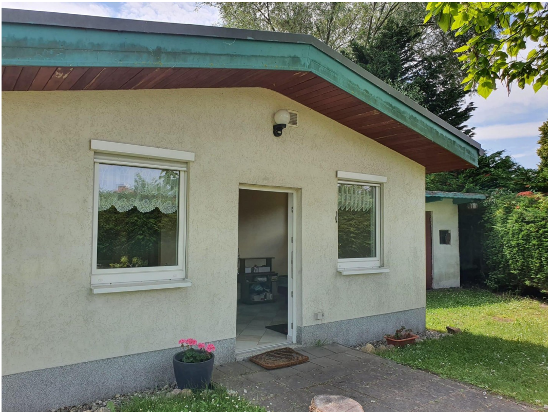
Haus - Vorderseite