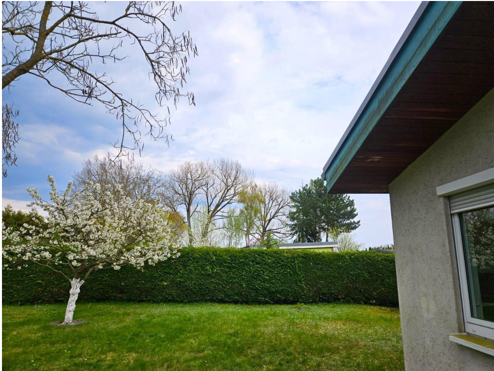
Frühling ist da!