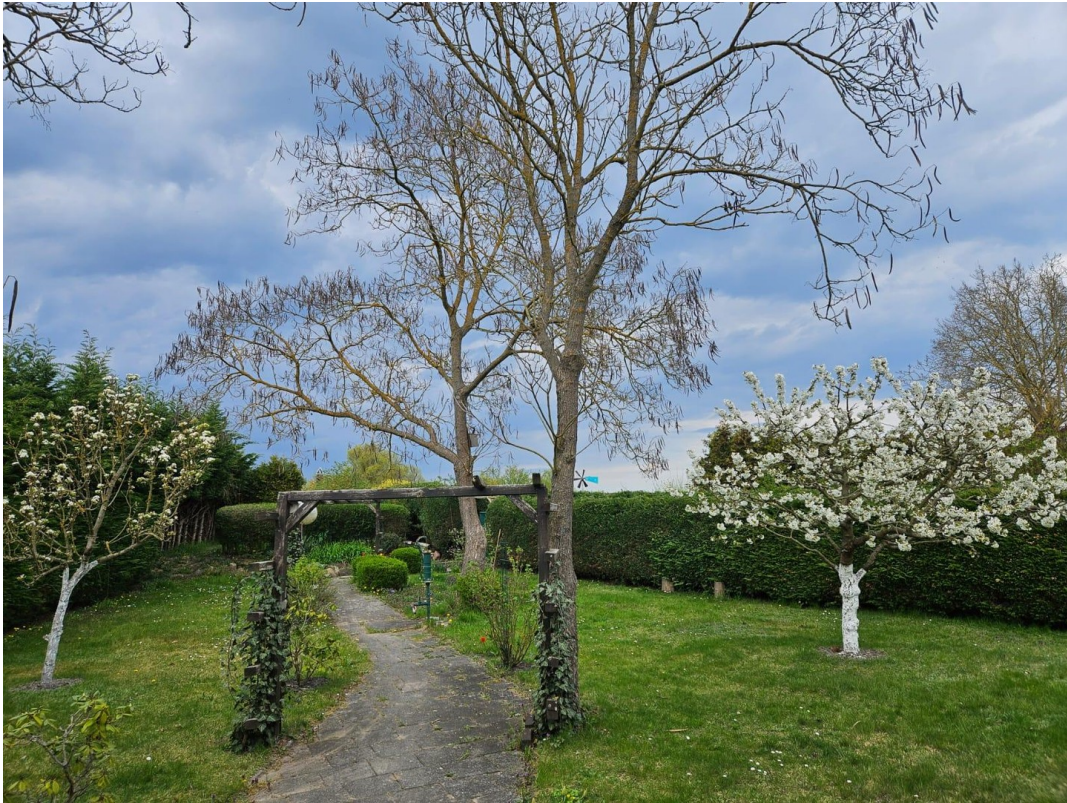
Blick aus dem Haus