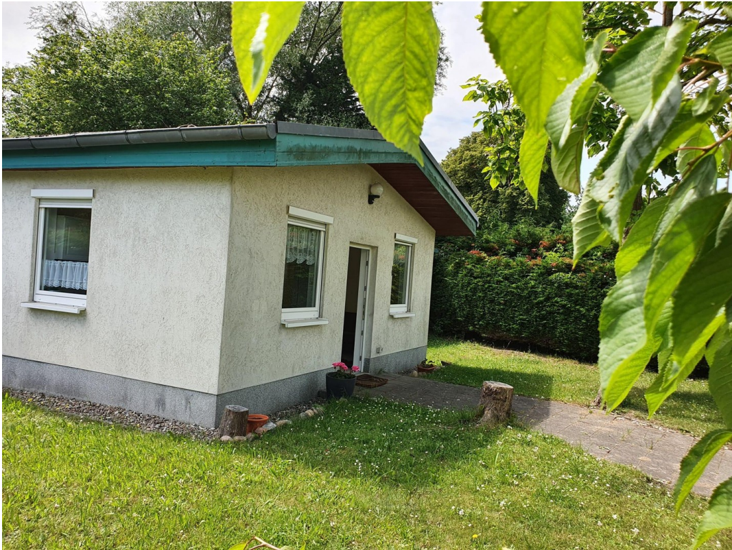
Haus – Seitenansicht