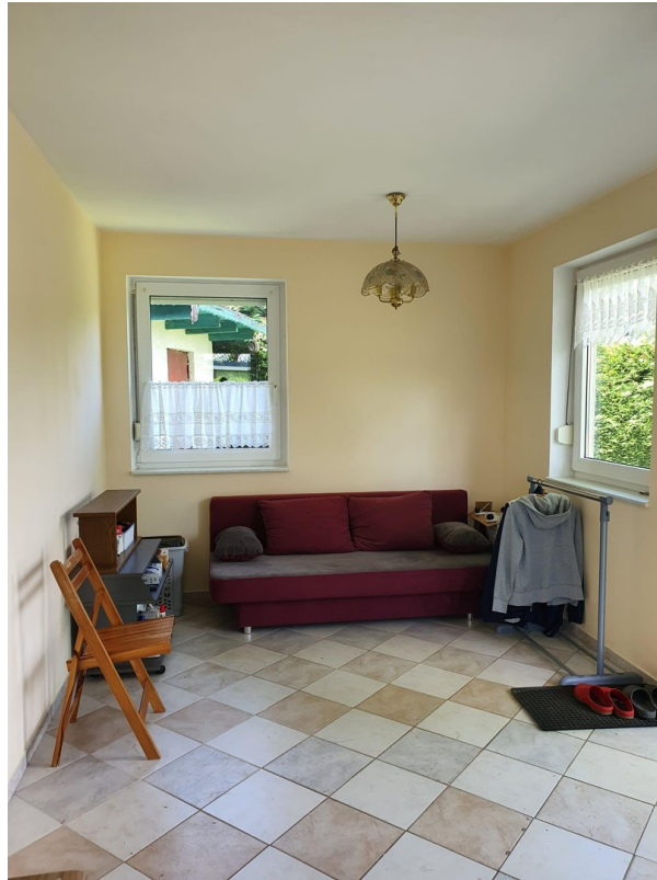
Wohnbereich mit Sitzecke