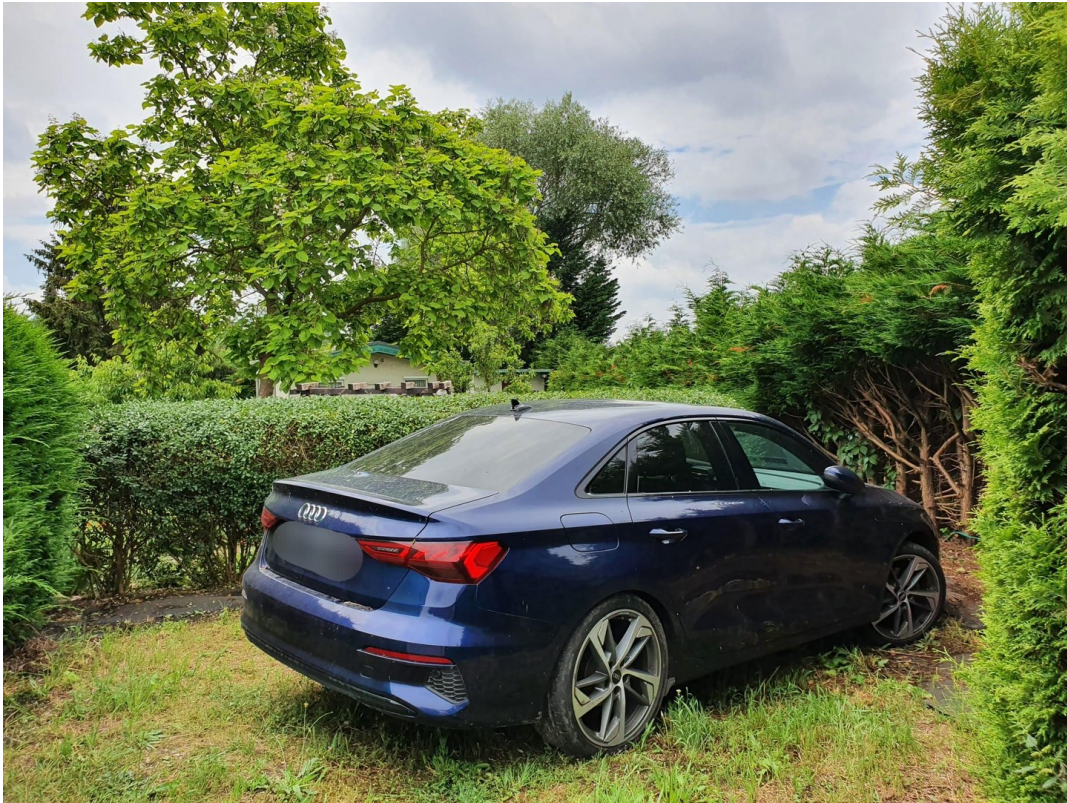
PKW-Stellplatz am Grundstück