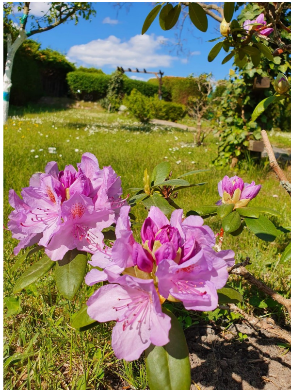
Schöne Wiese am Grundstück