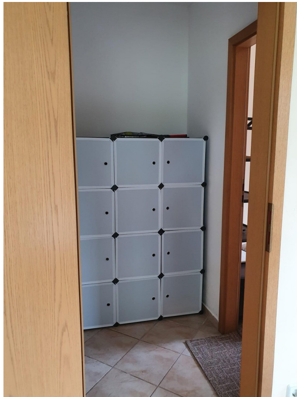
Zwischenraum / Diele