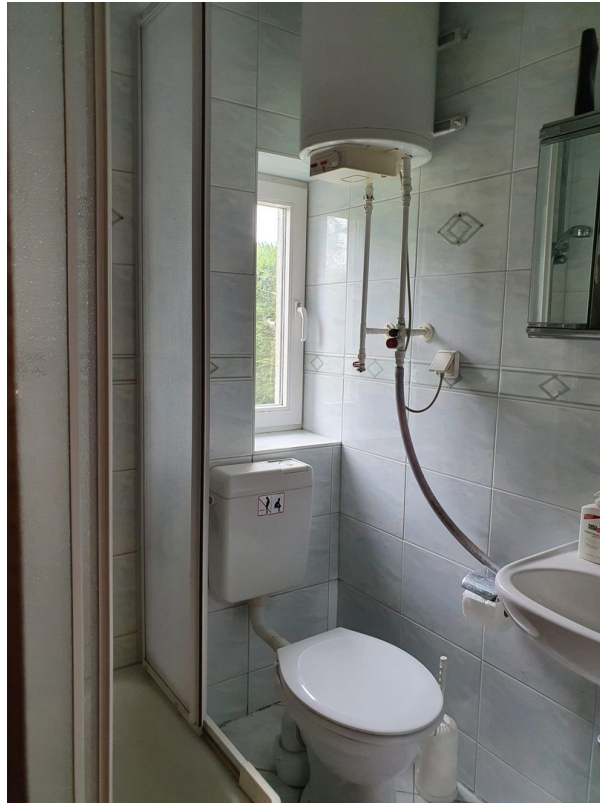
Badezimmer mit WC & Dusche