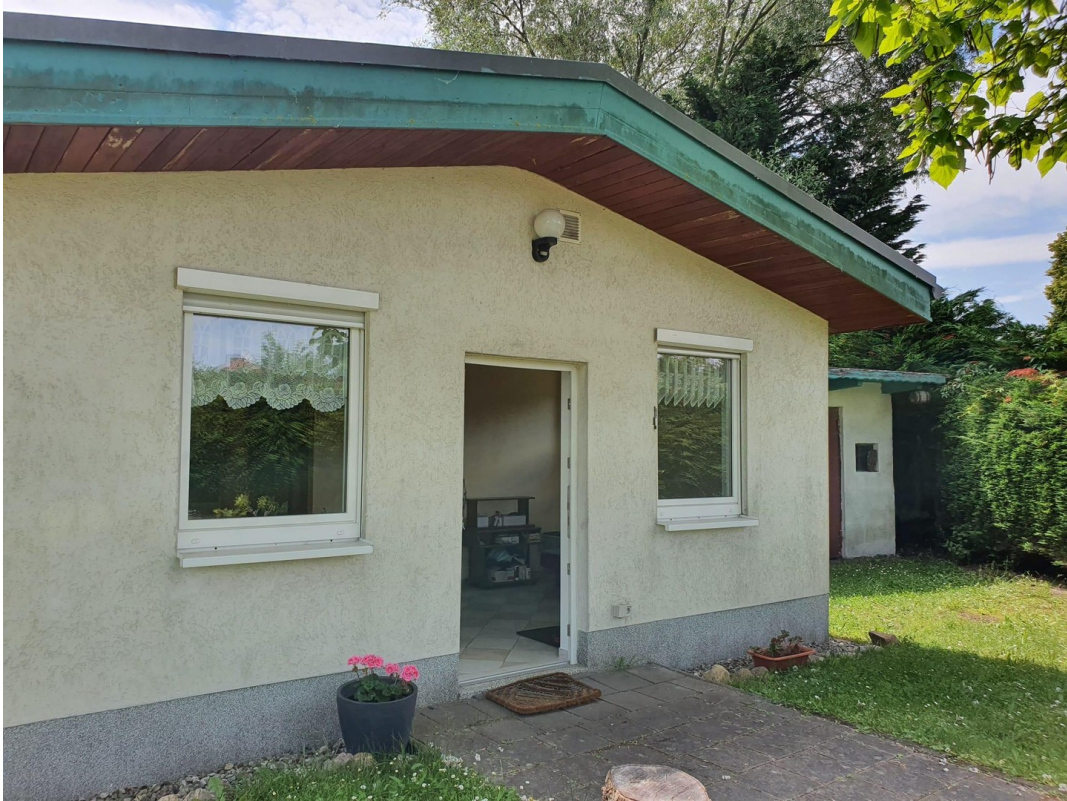
Haus - Vorderseite