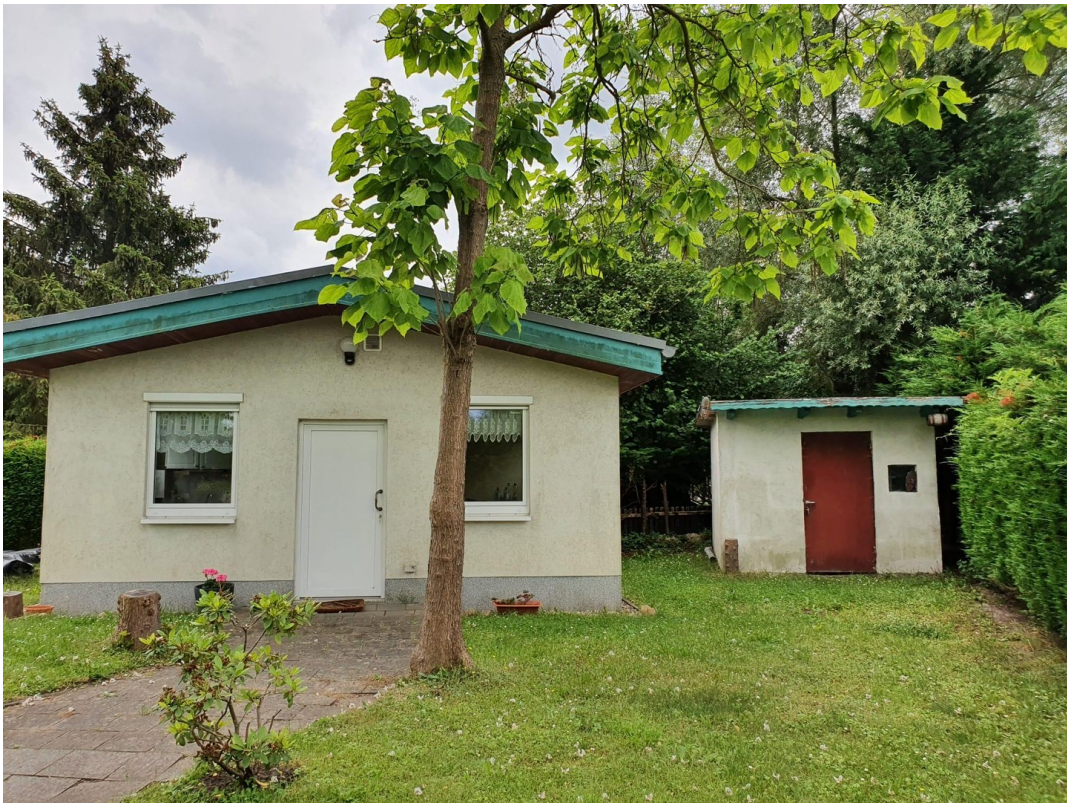
Haus von vorne & Nebengebäude