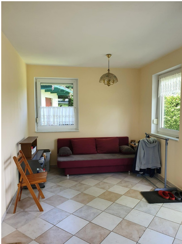
Wohnbereich mit Sitzecke