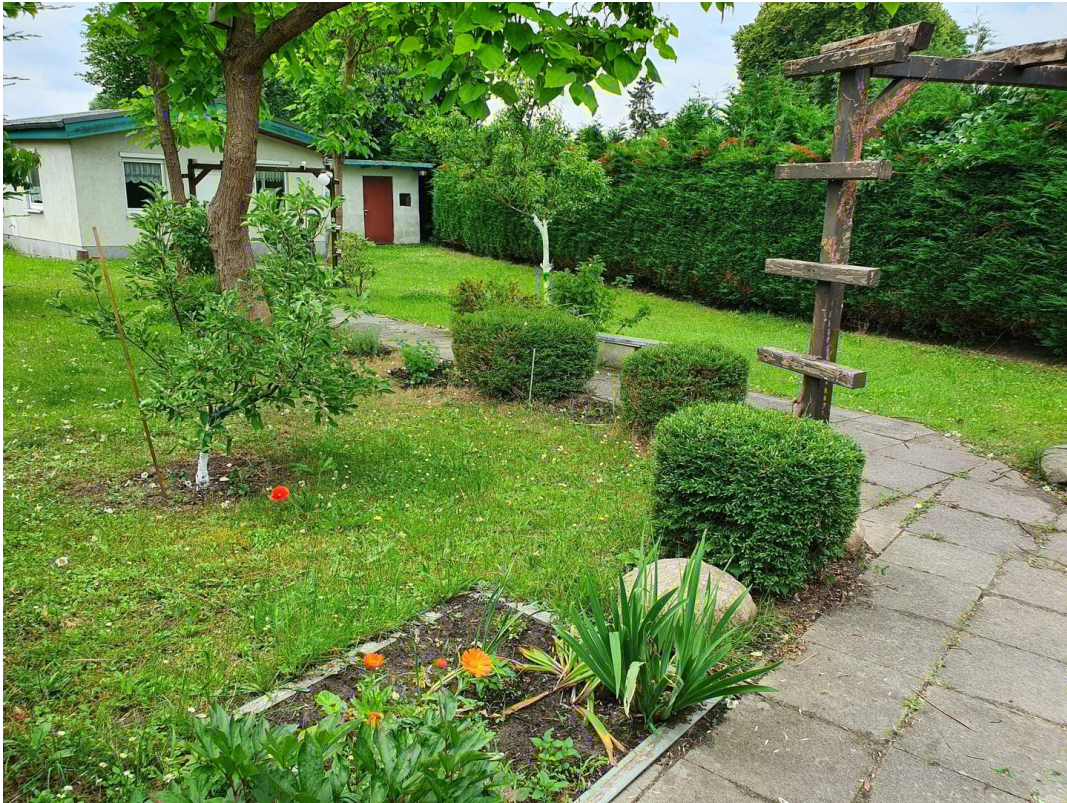
Eingangsweg zum Haus