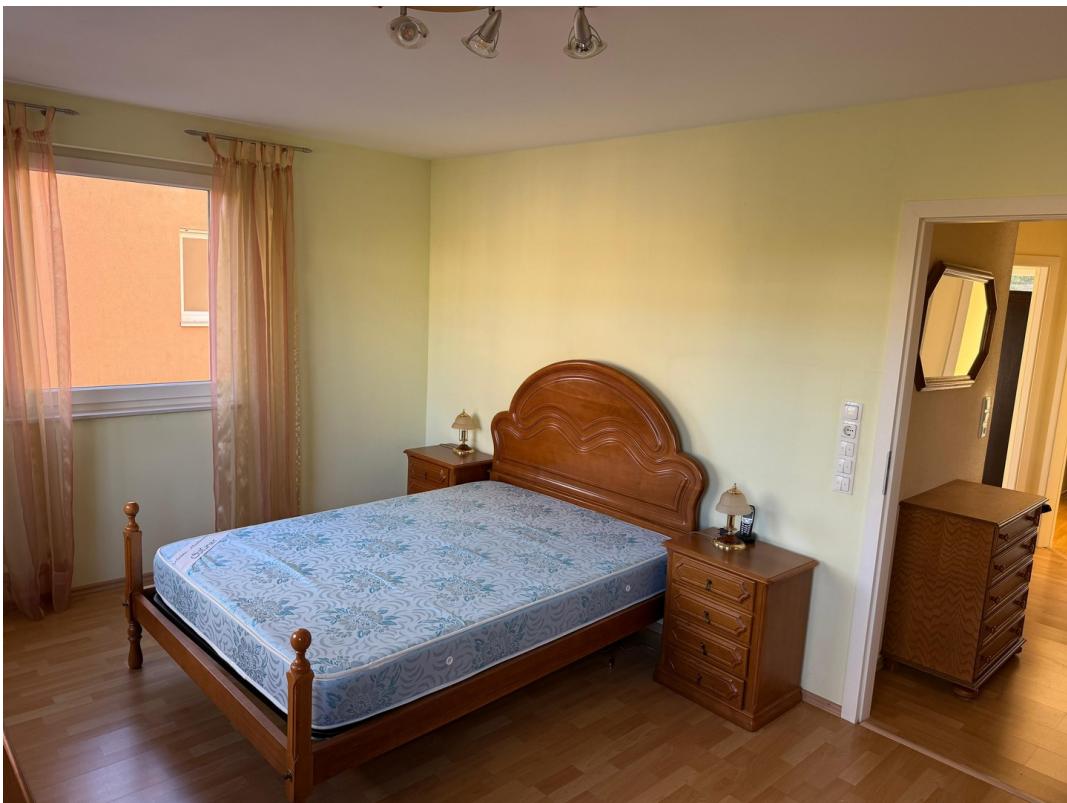
Erstes Schlafzimmer 1.OG