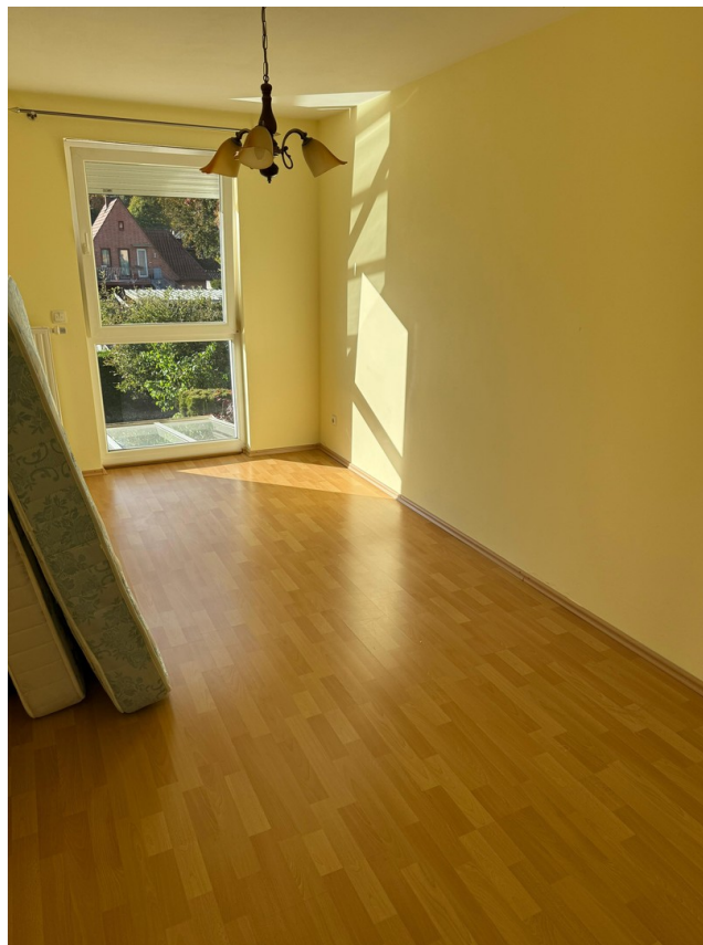
Drittes Schlafzimmer 1.OG