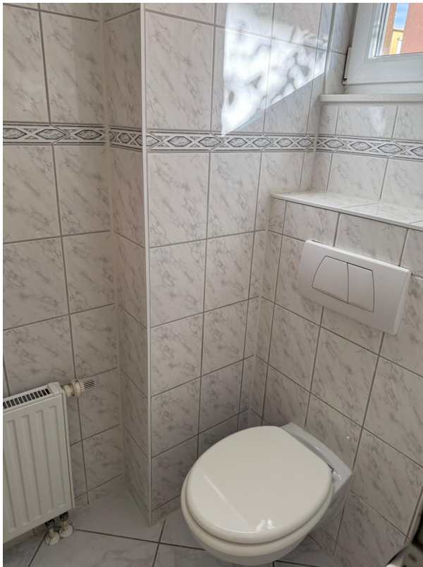
Gäste WC Erdgeschoß