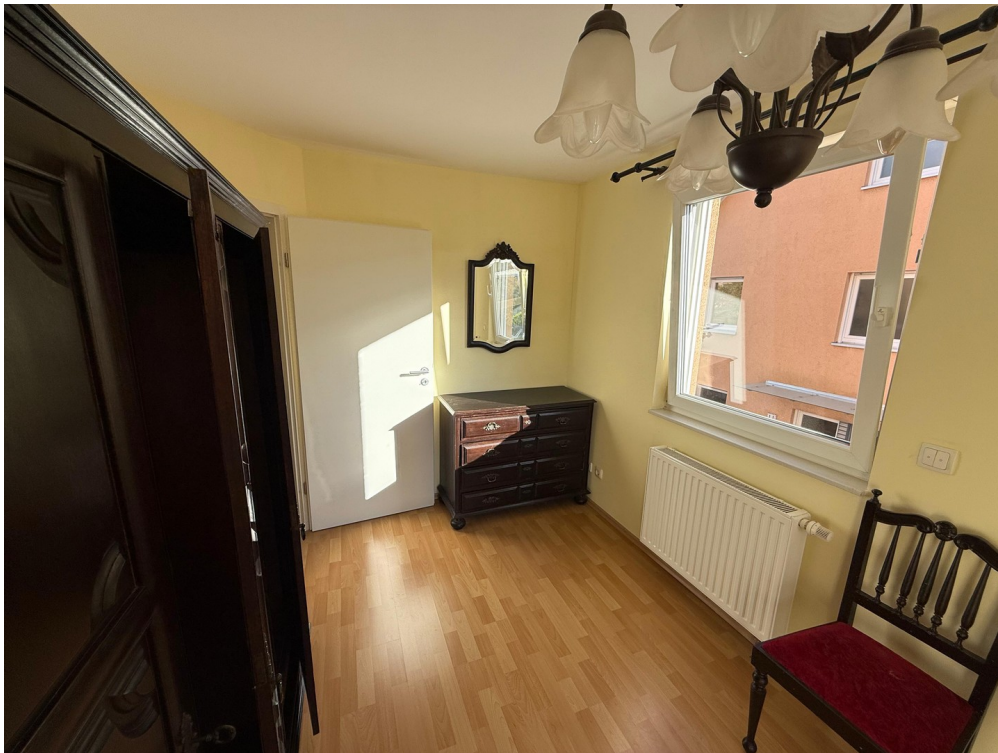
Zweites Schlafzimmer 1.OG