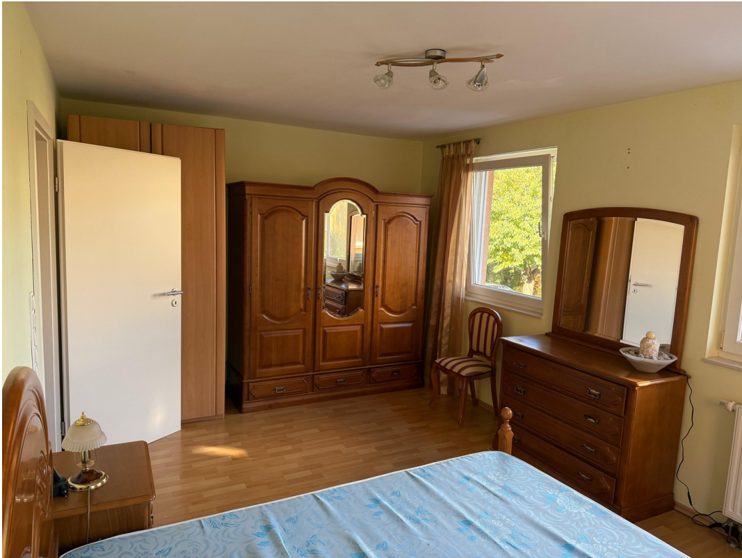
Erstes Schlafzimmer 1.OG