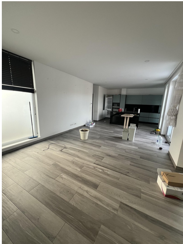
Wohnzimmer mit Küche