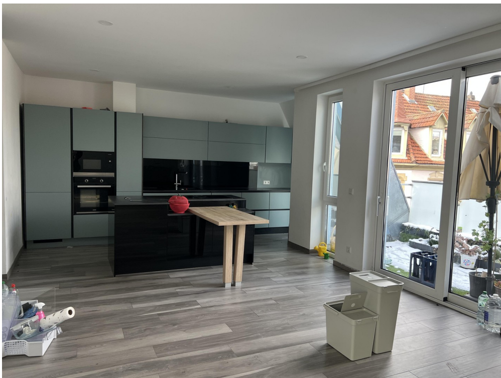
Einbauküche mit Insel