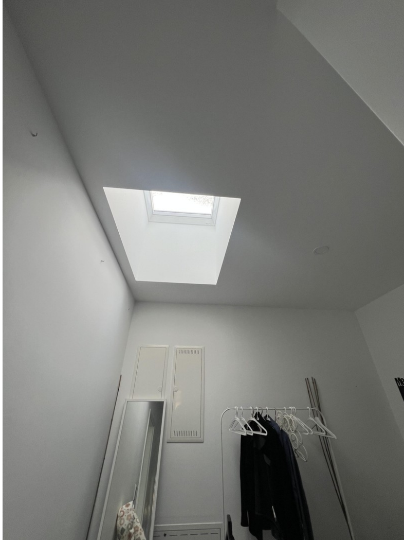
Flur / Eingang