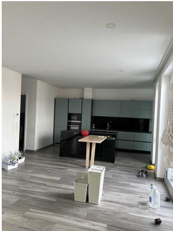
Einbauküche mit Insel