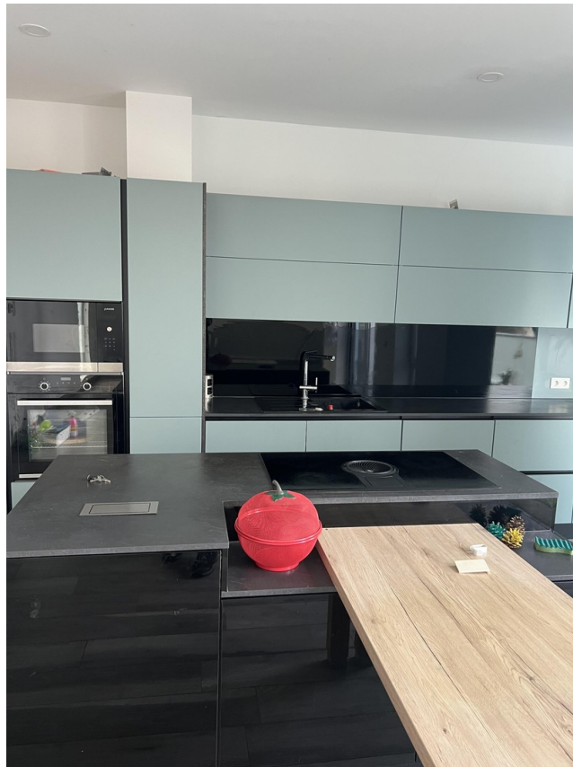
Einbauküche mit Insel