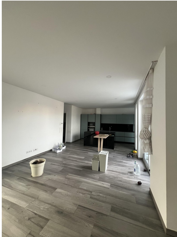
Wohnzimmer mit Küche