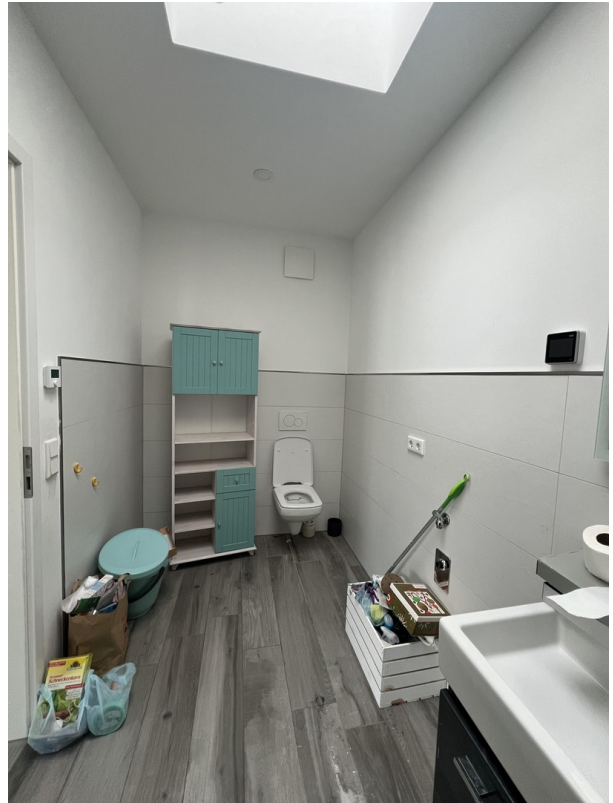
Badezimmer mit WC