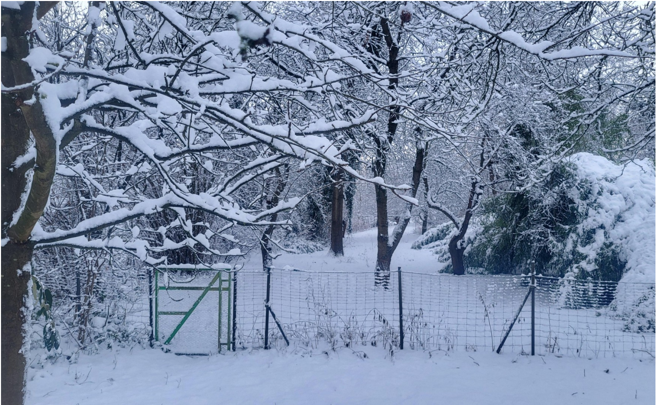
Blick ins Naturgrundstück