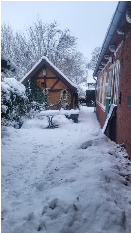
Südterrasse mit Gartenhaus