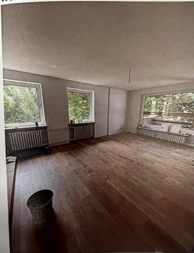
Wohnzimmer OG Rechts