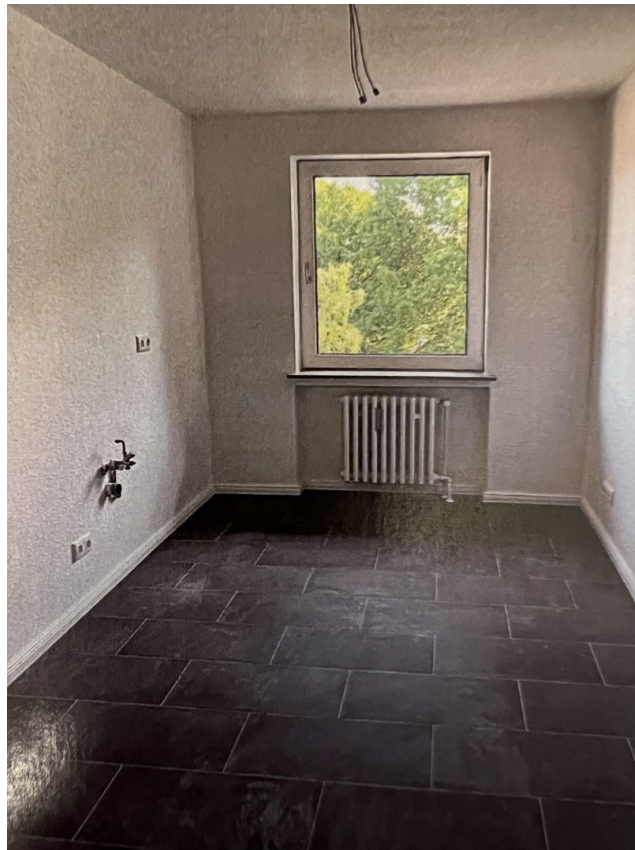
Küche geräumig u. neu gefliest