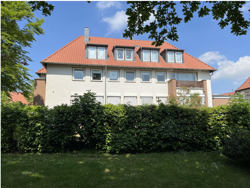
Wohnung im ersten OG