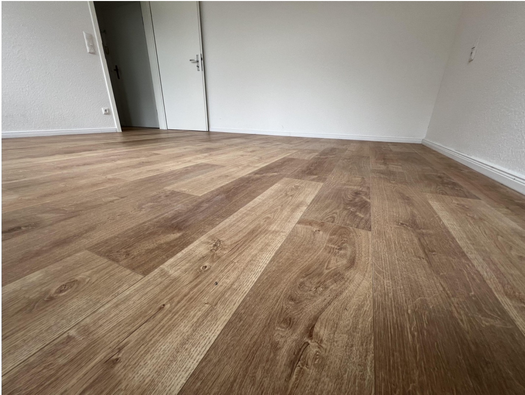
neuwertiger Laminatfußboden in