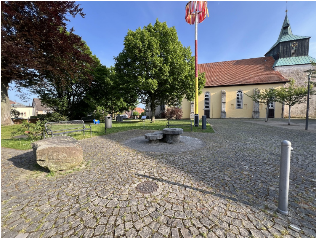
Zentral gelegen am Kirchplatz