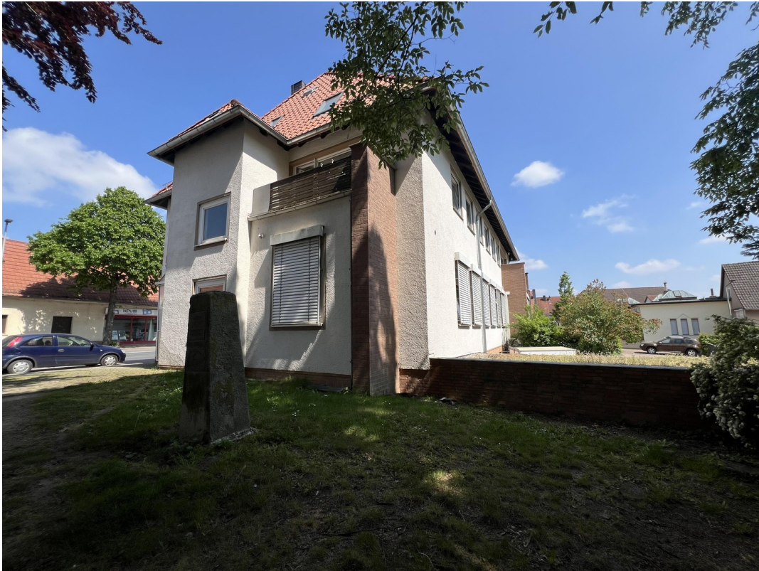
Wohnung mit Balkon