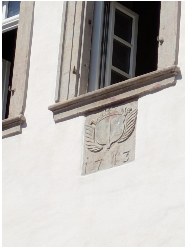
barocke Hofreite von 1713