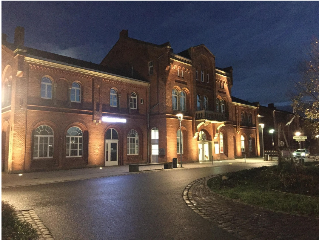
Stadtseite bei Nacht