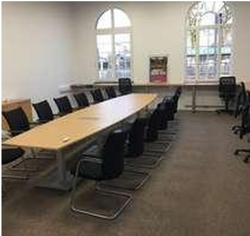
Großer Raum 55 m 2