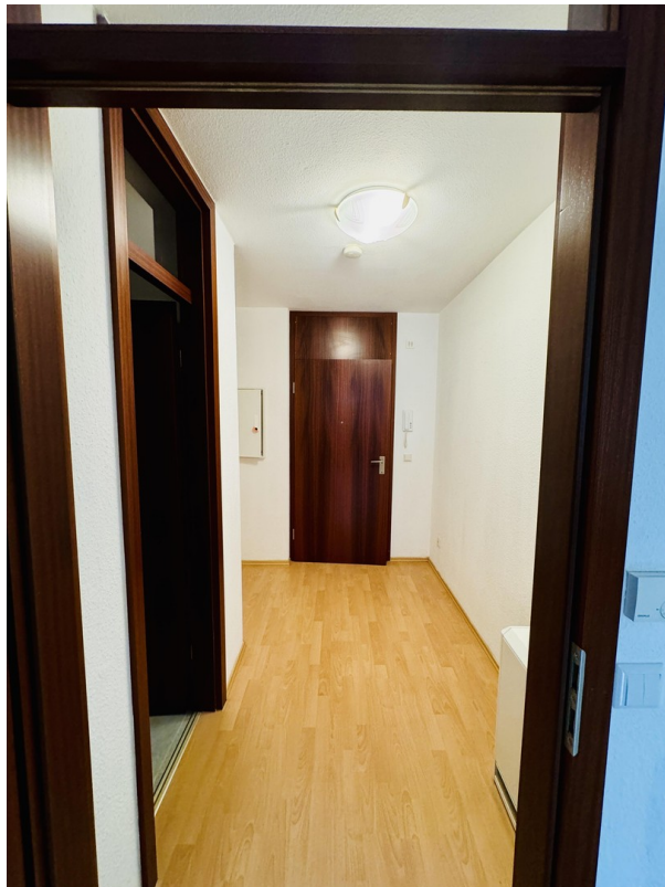
Flur / Eingang