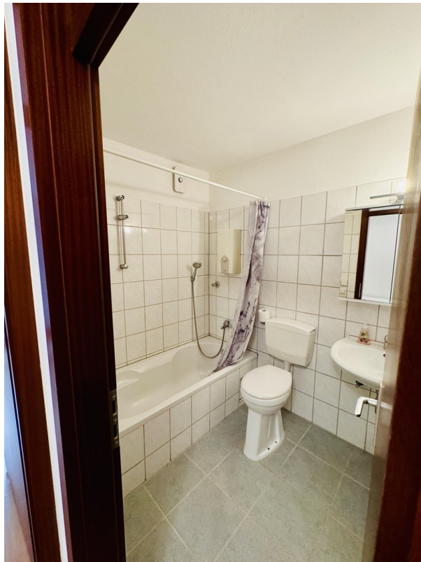
Bad mit Duschwanne