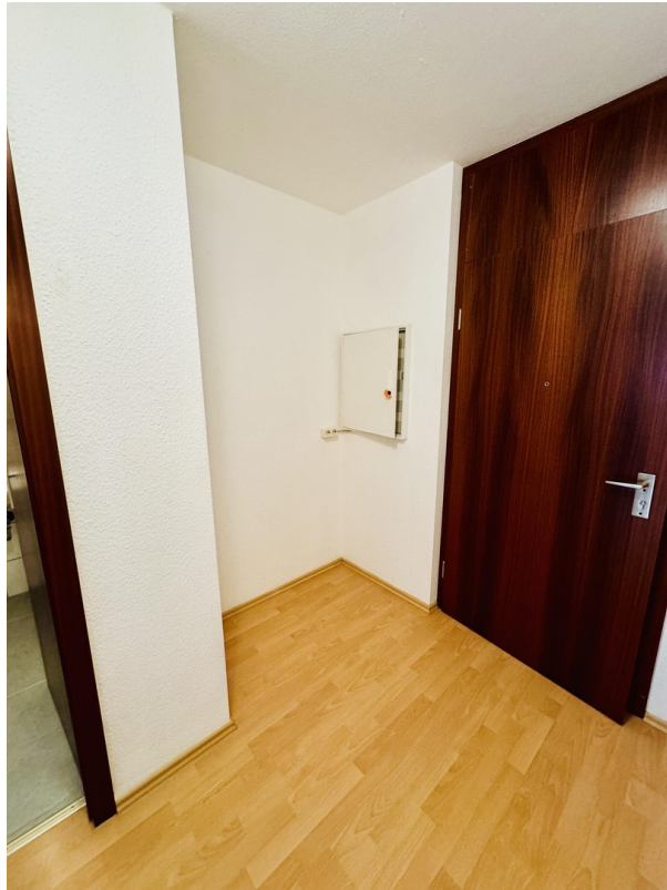
Abstellraum im Flur