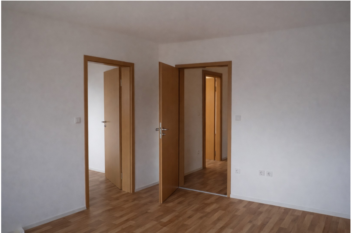
Wohnzimmer auf Flur