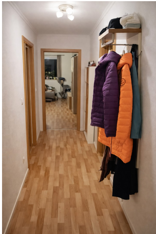
Flur mit Möbeln