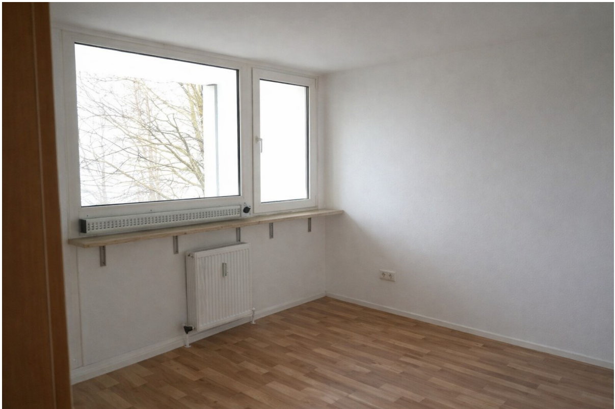
Schlafzimmer auf Loggia