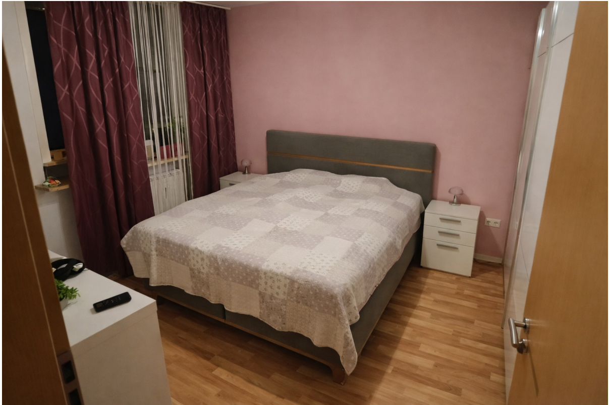
Schlafzimmer mit Möbeln 2