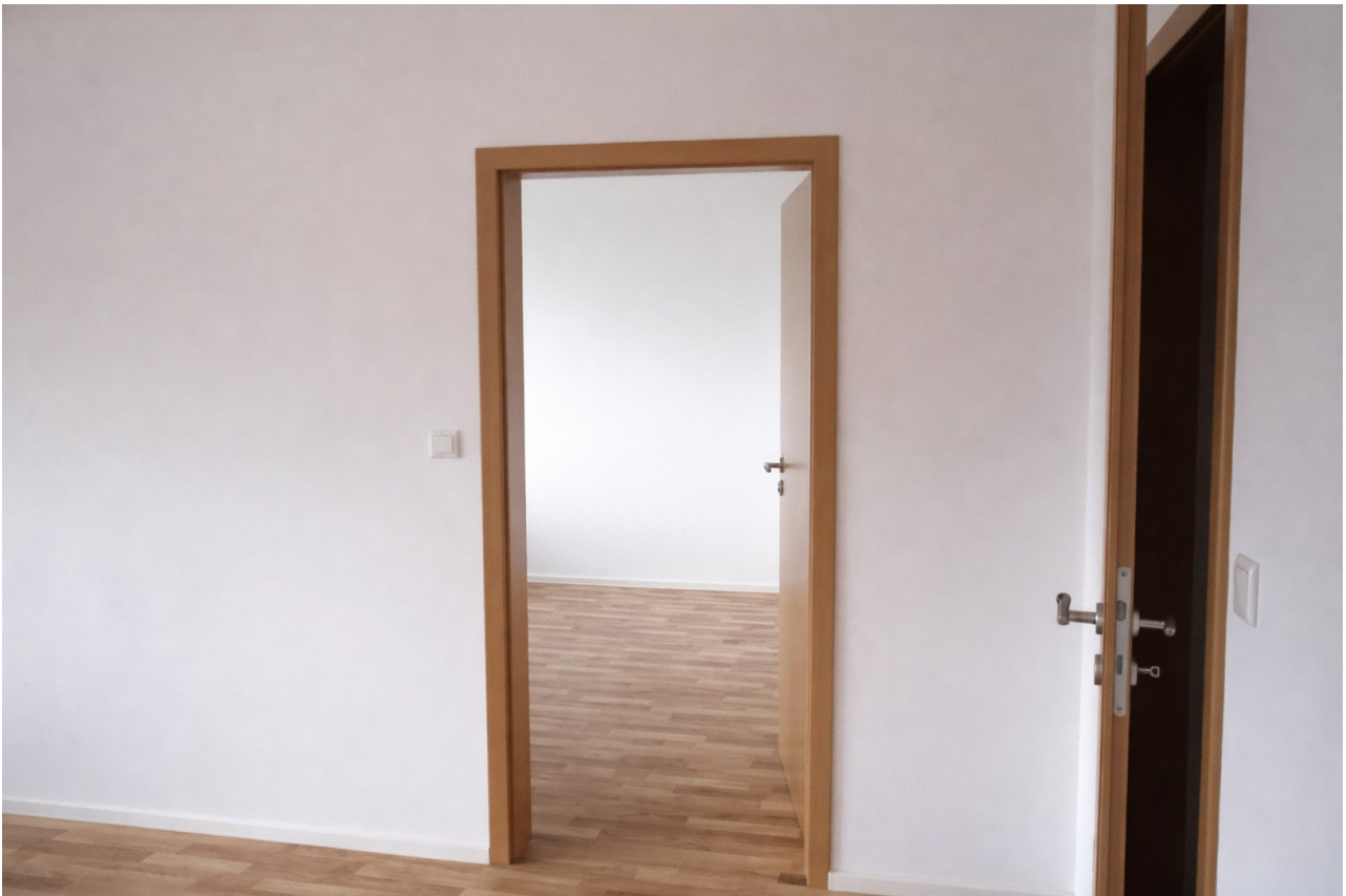
Wohnzimmer auf Schlafzimmer