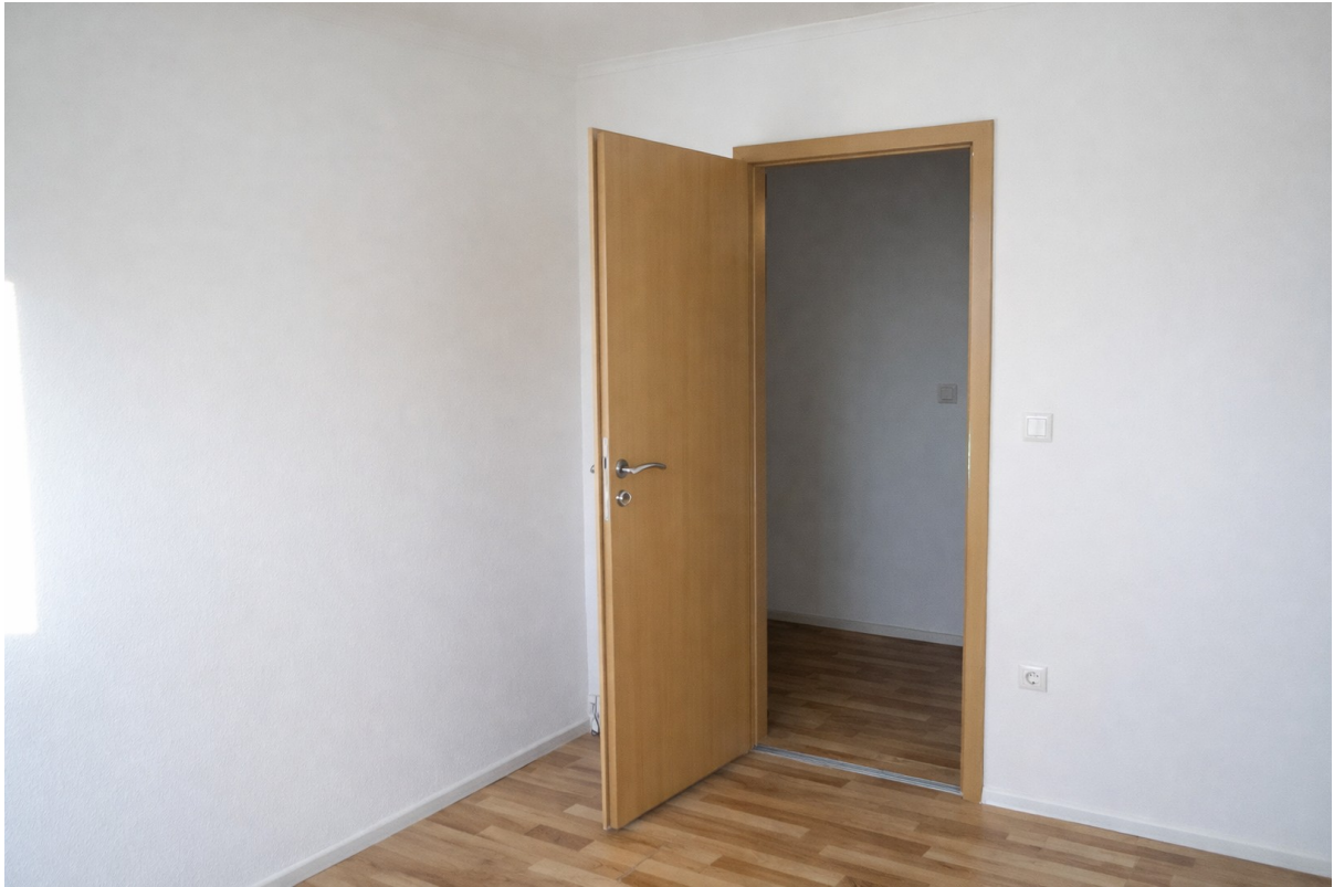
Kinderzimmer auf Flur