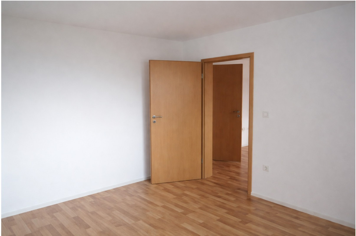
Schlafzimmer auf Wohnzimmer