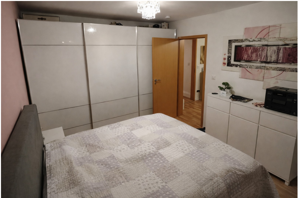
Schlafzimmer mit Möbeln