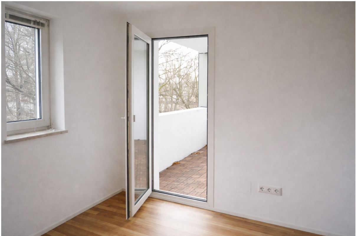
Wohnzimmer auf Loggia