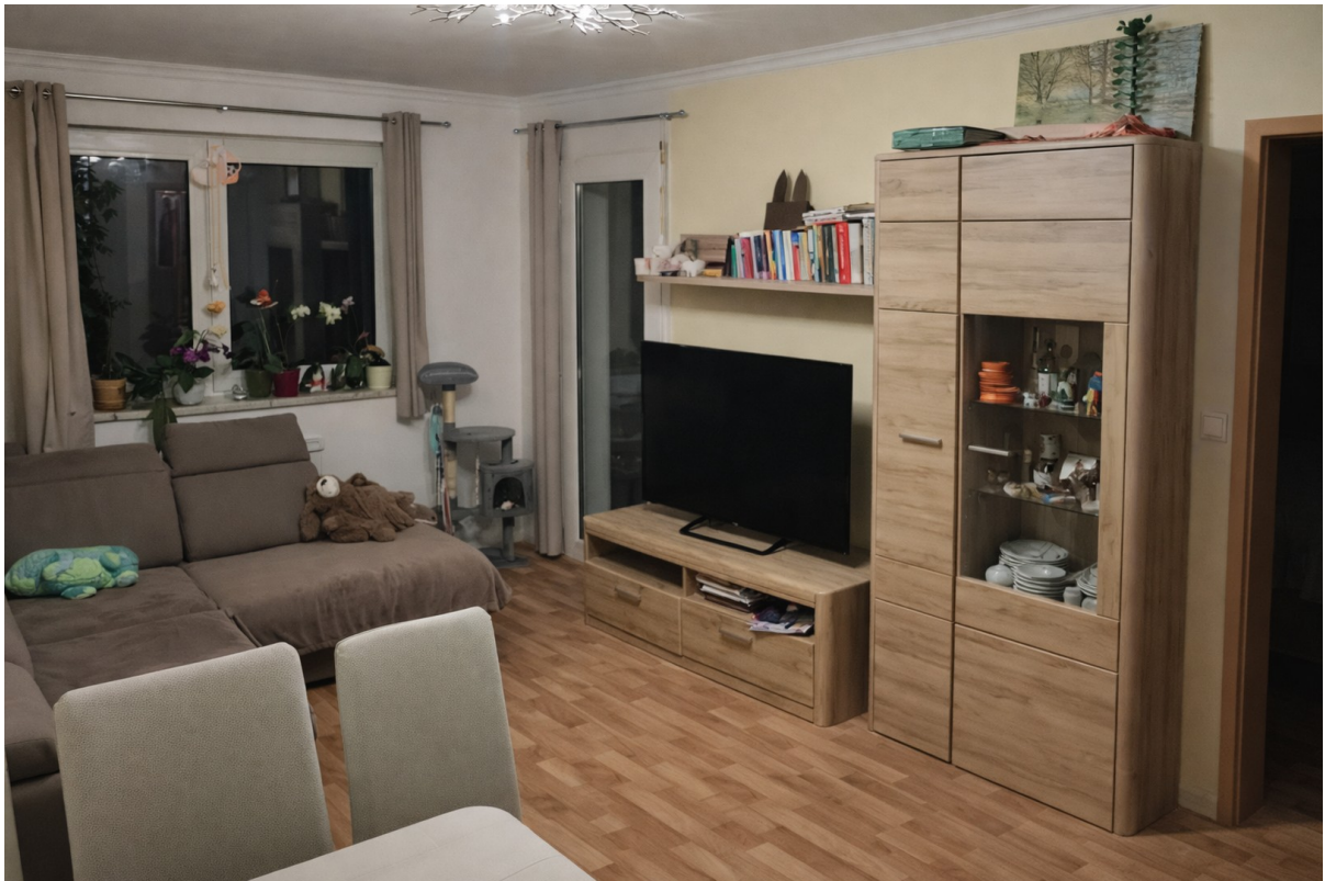
Wohnzimmer mit Möbeln