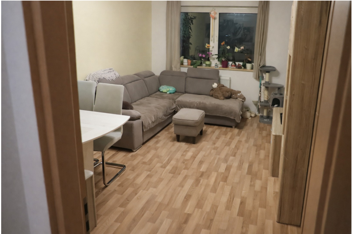
Wohnzimmer mit Möbeln 2