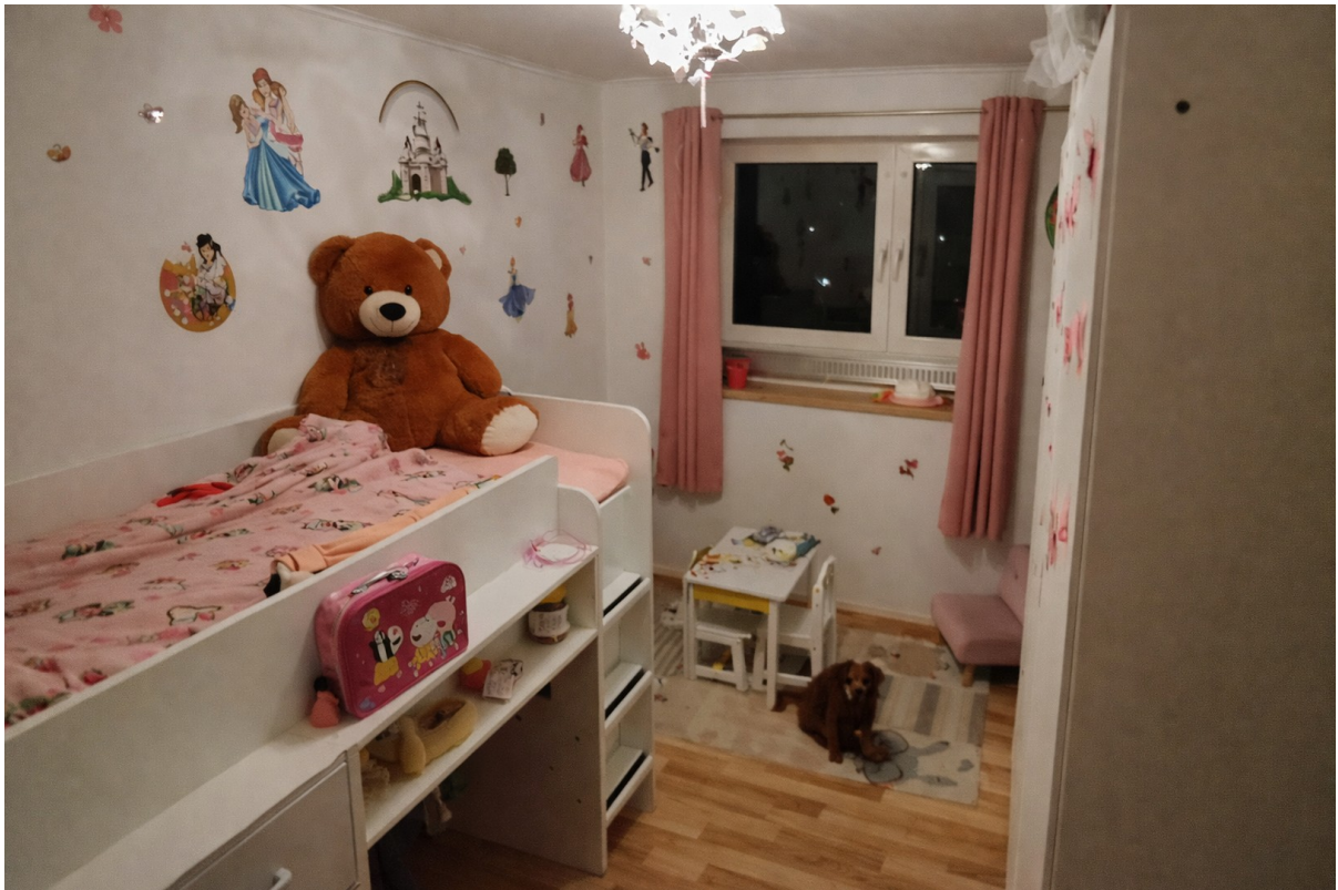
Kinderzimmer mit Möbeln