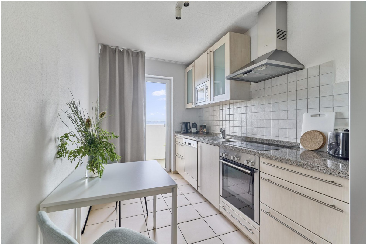
Küche und Balkon2