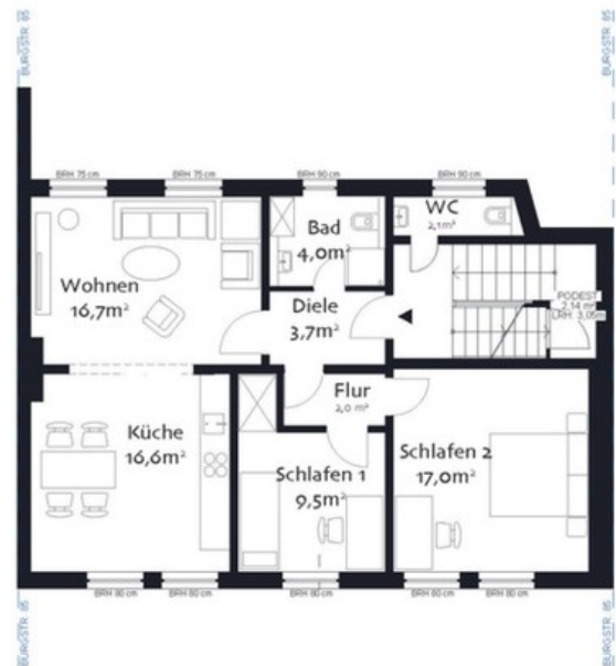
Grundriss 1. OG