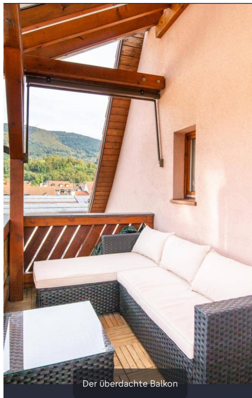
Der überdachte Balkon