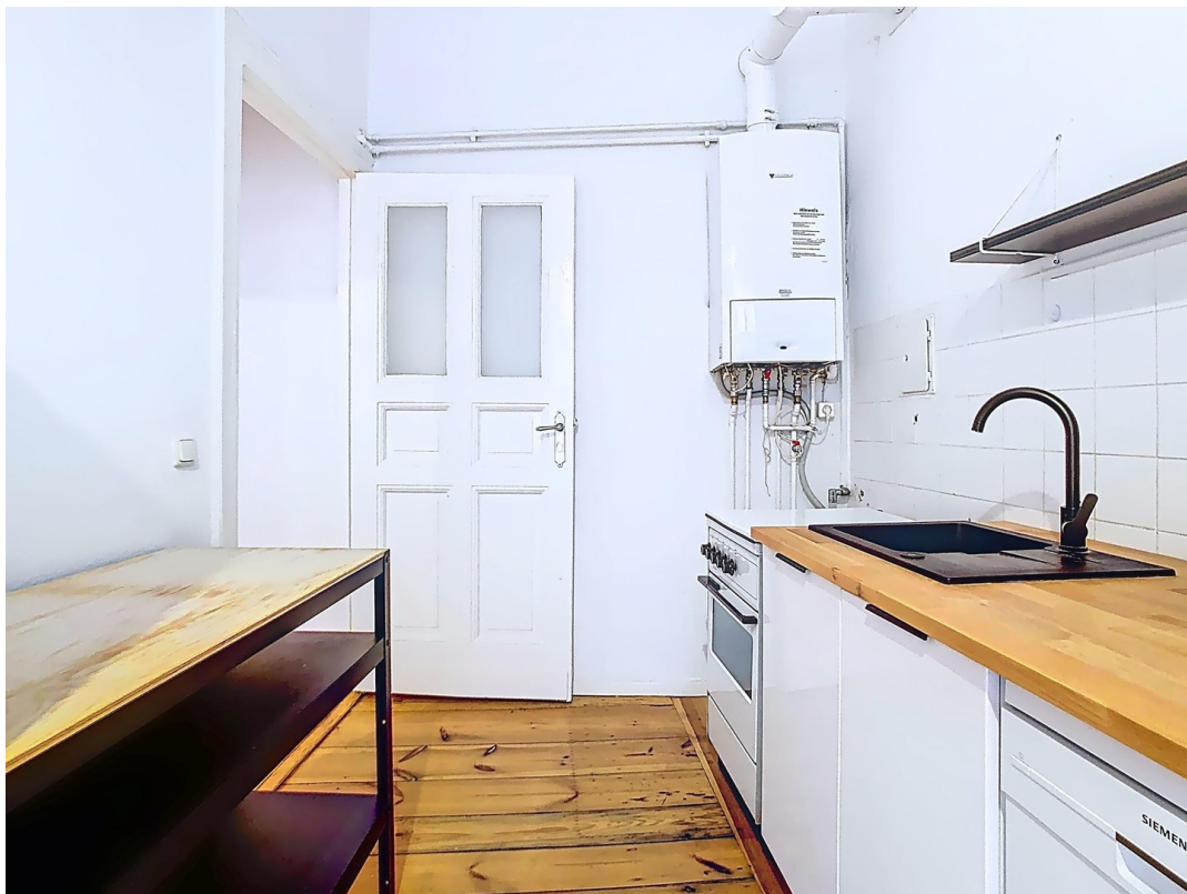
Küche mit kleiner EBK