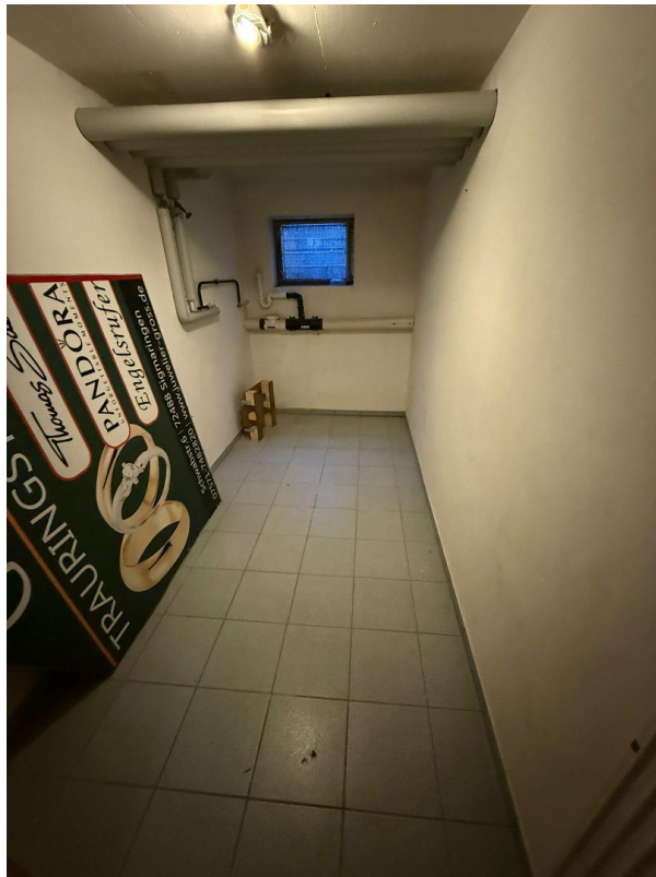
UG Keller Wascheraum