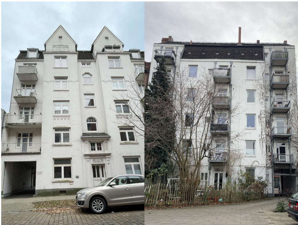
Hausansicht vorne und hinten