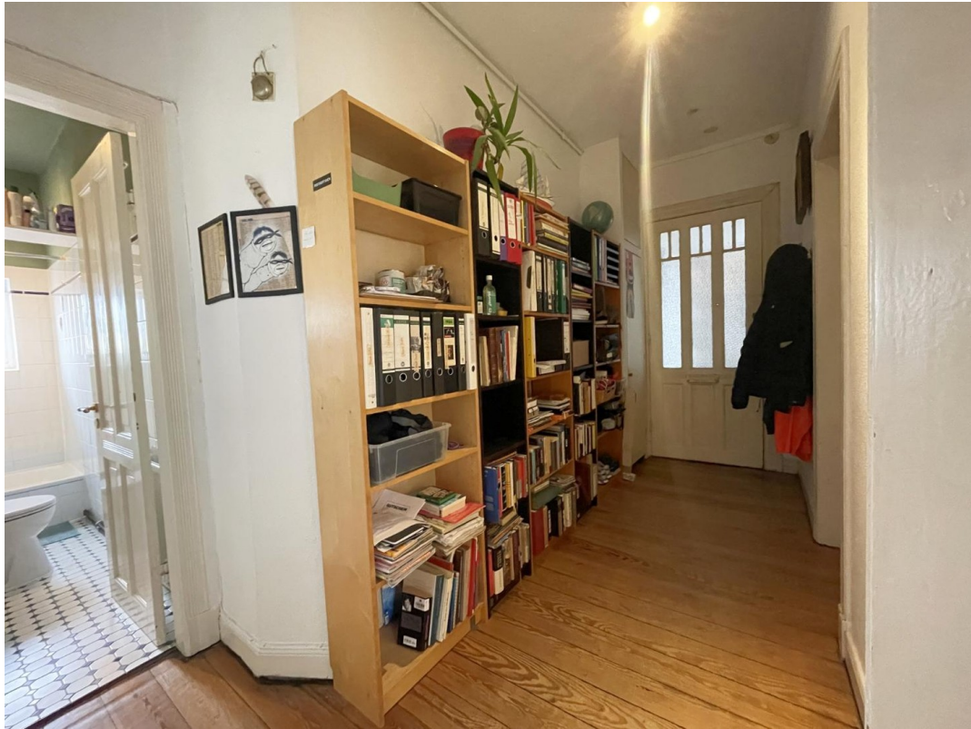
Flur Richtung Ausgang