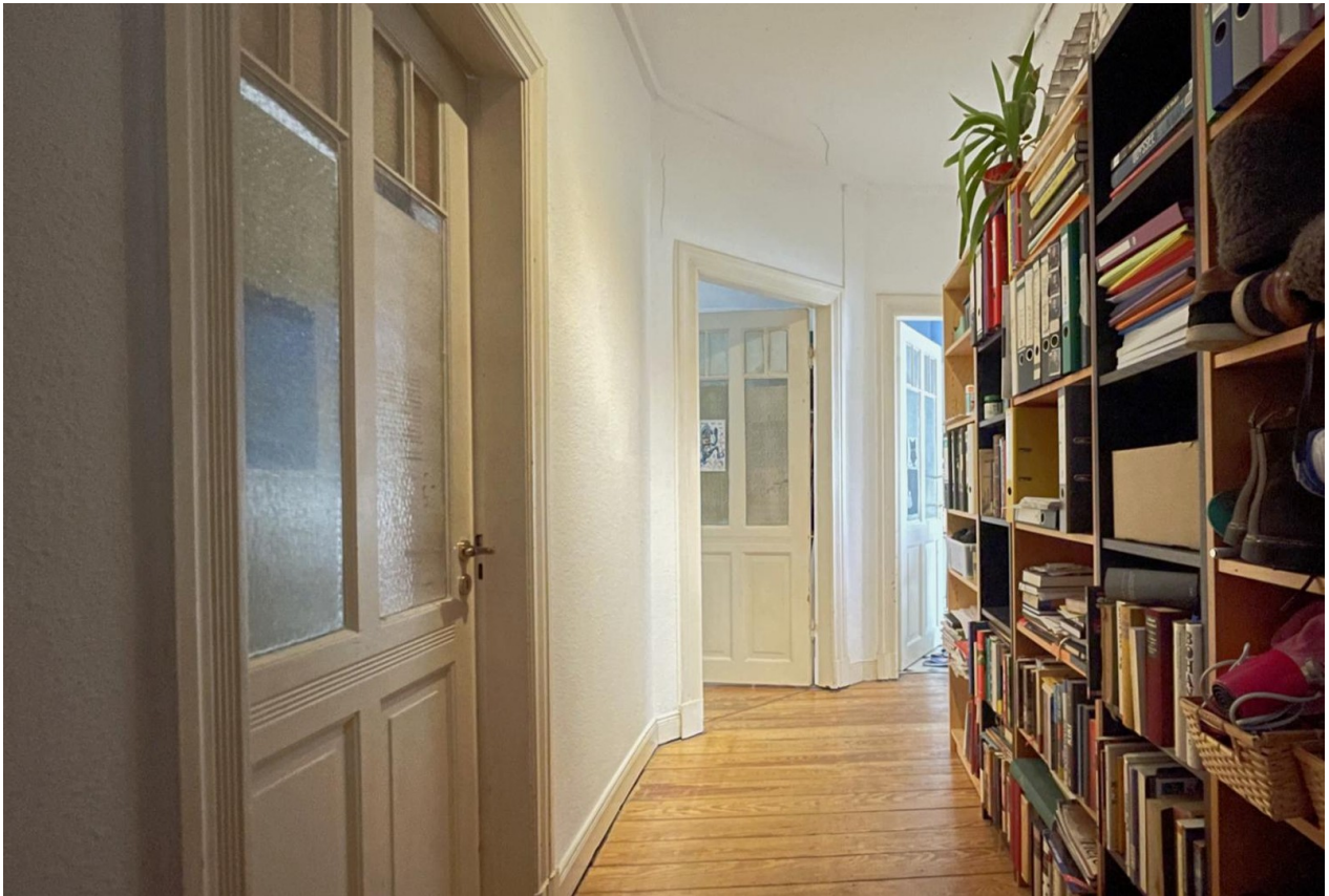
Flur Richtung Küche