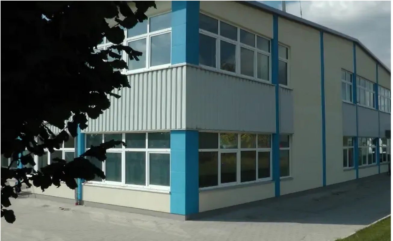
Südostseite mit Büros in OG+EG