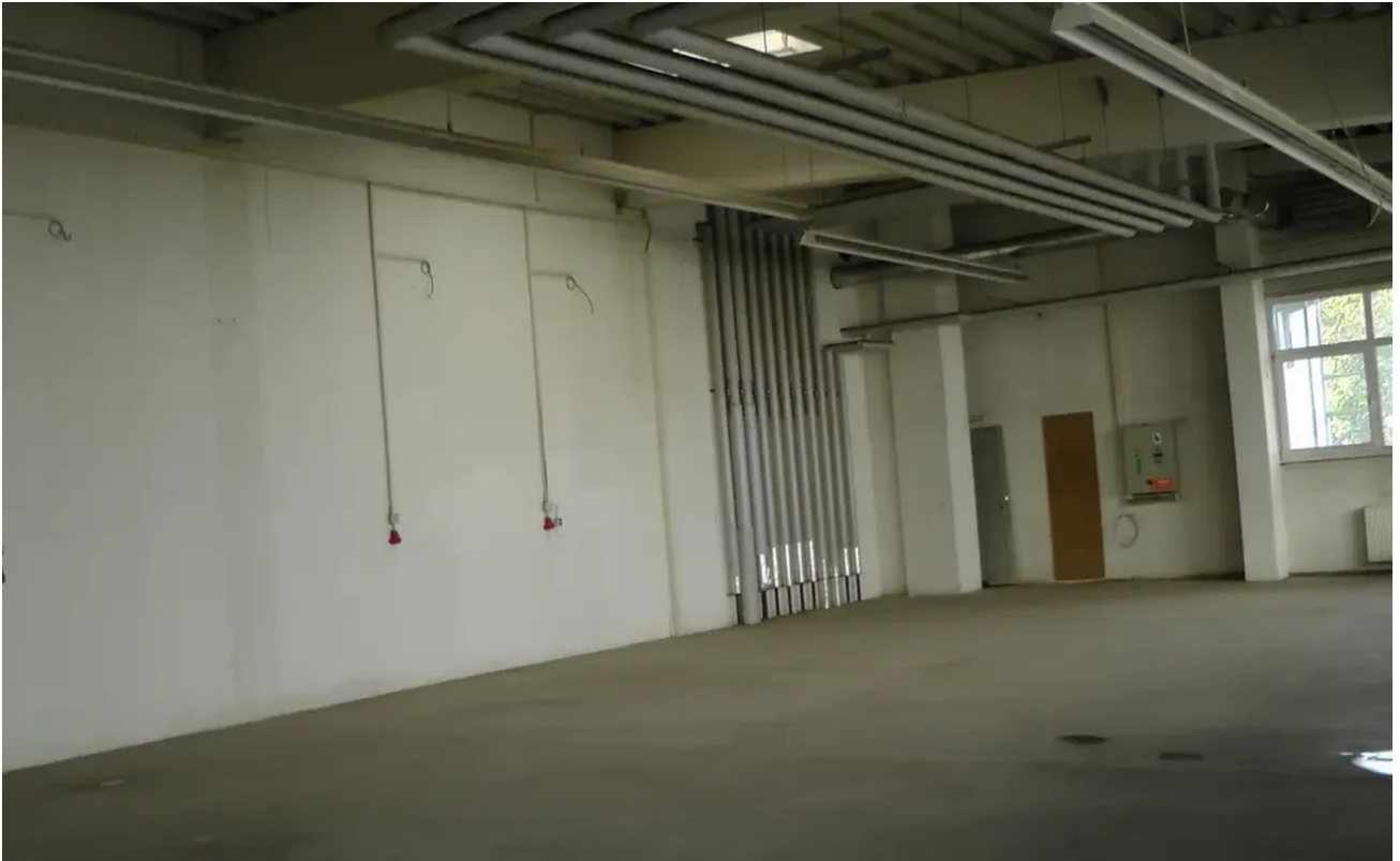
Eine der Werkstätten