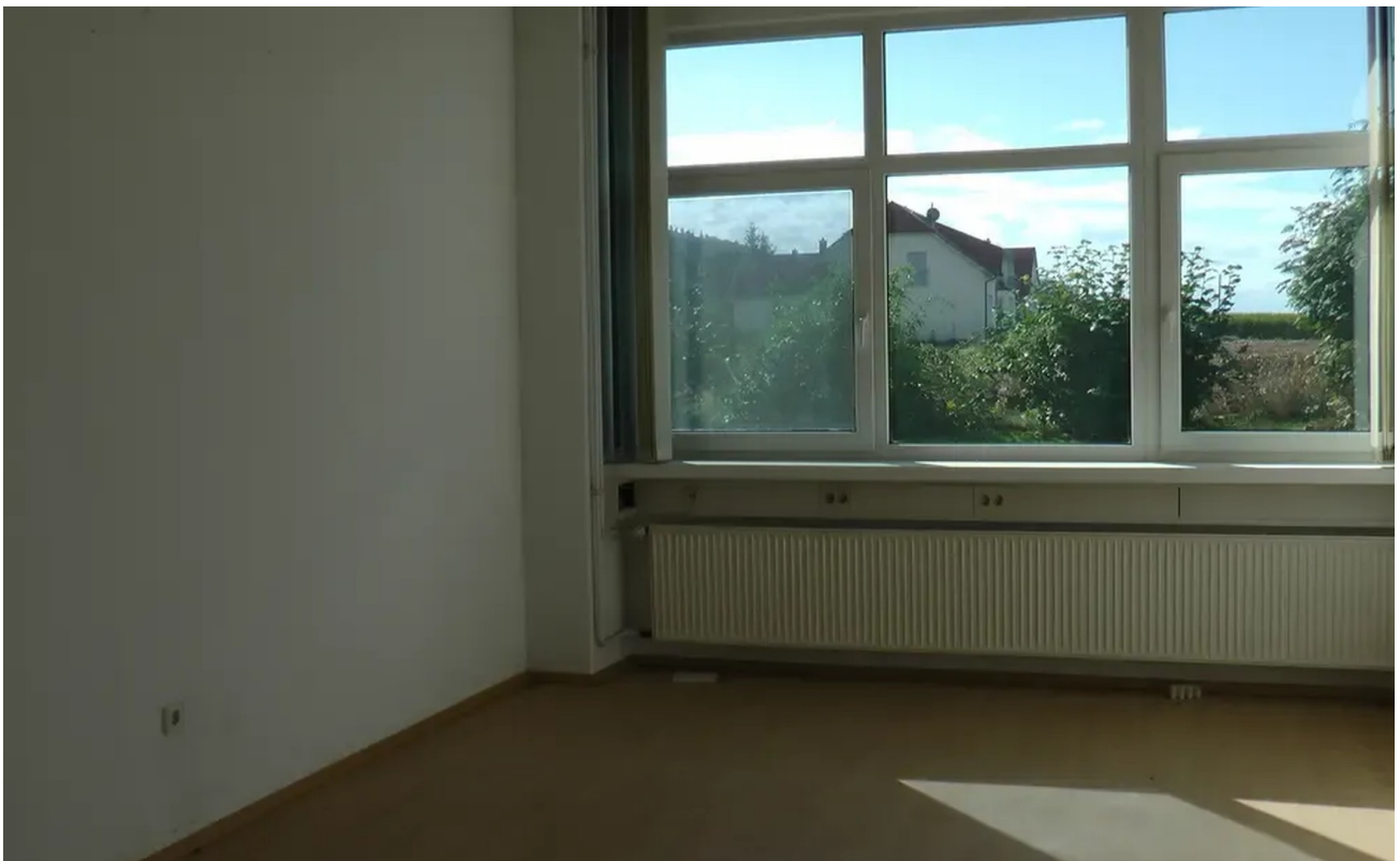
Eines der klimatisierten Büros