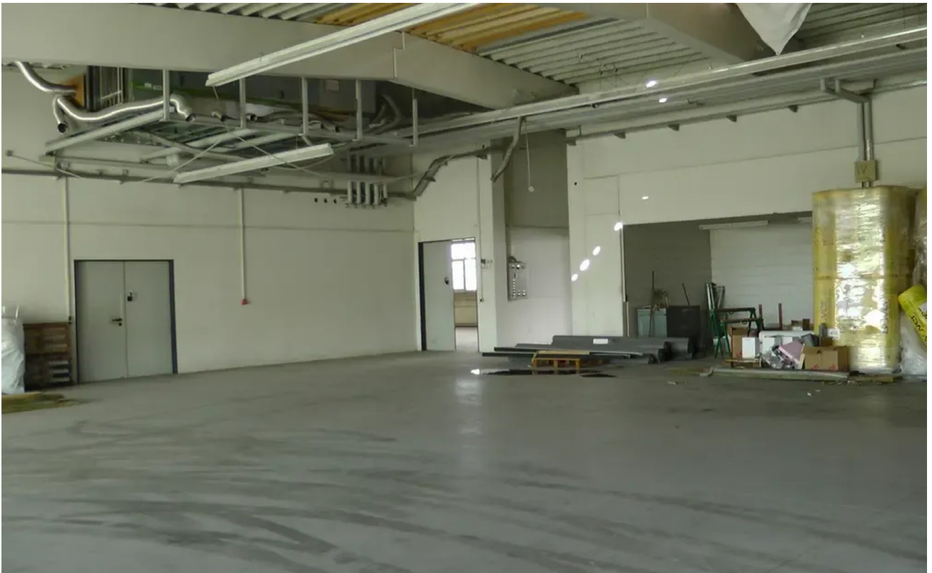
Zentralbereich mit Lagerflächen